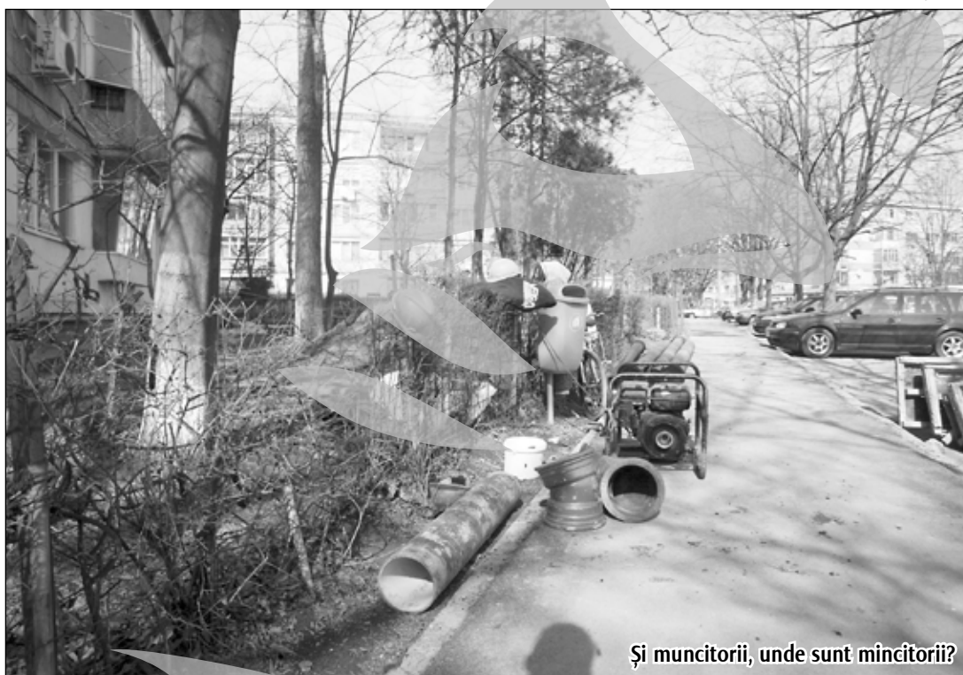
Și muncitorii, unde sunt muncitorii?

Potrivit datelor Casei Județene de Pensii și Alte Drepturi de Asigurări Sociale (CJPAS), în aprilie au primit pensie de stat sau de agricultor 147.245 de gălățeni. Acestora li se mai adaugă și cei care primesc pensii speciale, dar al căror număr nu este, din câte înțelegem noi, atât de mare încât