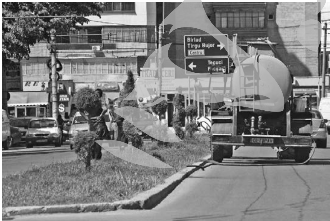
Fiindcă nu prea are cu ce să îngrijească spațiile verzi din Galați, ADP a închiriat șapte utilaje de la Atlas, pentru 94.000 de euro