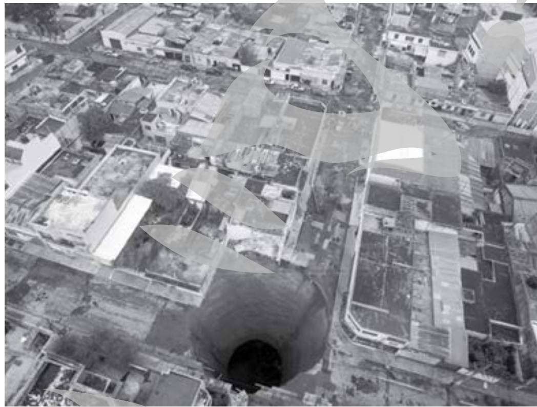
Nu vă supărați, pe unde pot ajunge în... centrul Pământului?

alte 53 de persoane sunt date dispărute, conform serviciilor de urgență, la doar câteva ore după erupția Vulcanului Pacaya, în care au murit două persoane, iar alte trei au fost date dispărute. Agatha, care s-a transformat duminică în depresiune, a făcut ravagii în Oceanul Pacific, după ce meteorologii Agenției americane Oceanice și Atmosferice, NOAA, au prezis că sezonul uraganelor din acest an (1 iunie - 30 noiembrie) ar putea fi unul dintre cele mai devastatoare înregistrate vreodată în Atlantic. În condiții meteorologice de cer parțial acoperit, luni dimineața, în Guatemala au început operațiunile de curățare. Sinistrații încercau să recupereze unele bunuri sau să "spele" casele acoperite sau distruse de noroi. În total, 112.000 de persoane, majoritatea sărace, a fost necesar să fie evacuate. Ele trăiau în locuințe ridicate, în cele mai multe cazuri, la poalele colinelor sau pe malurile râurilor. Pentru a