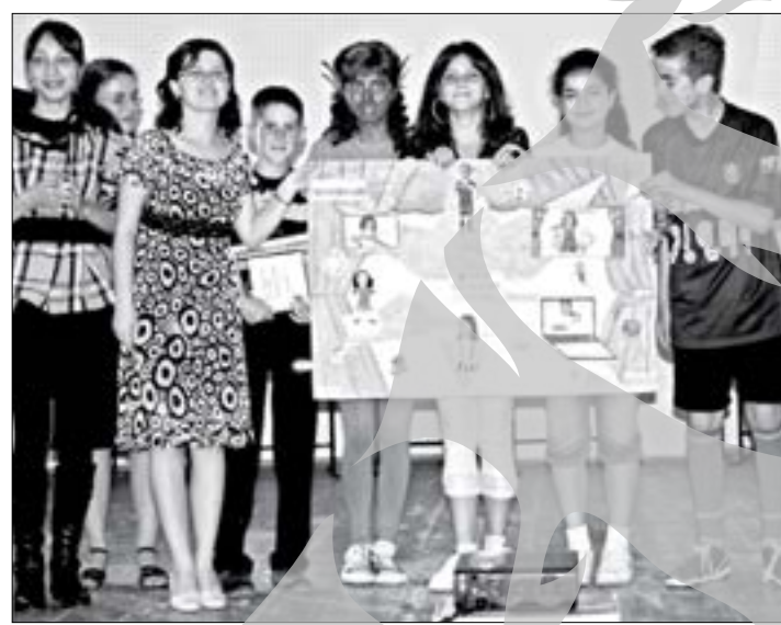
Cea mai bună trupă din concurs, de la Șchela

Premiul „Vieții libere” a ajuns la trupa Școlii Nr. 13 „Ștefan cel Mare”