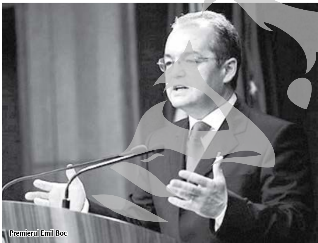
Premierul Emil Boc

Președintele Camerei Deputaților, Roberta Anastase, i-a acuzat pe reprezentanții PSD și PNL din Birourile Permanente reunite că încearcă să tergiverseze adoptarea pachetului de măsuri propus de Guvern, implicat a asumării răspunderii, și a declarat că nu vede rostul prezenței premierului în ședința conducerii Parlamentului. Roberta Anastase a subliniat că