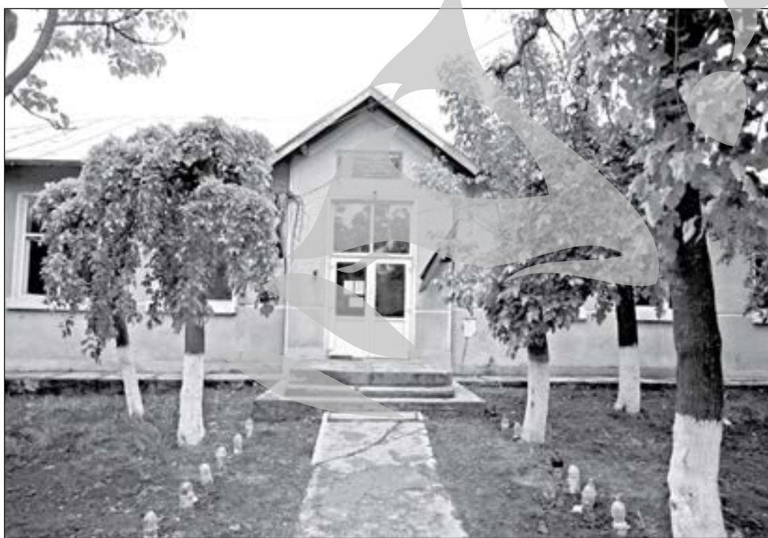
Școala ce așteaptă să fie reparată

Astăzi nu mai mergem pe poteci umbroase, asfaltul ne dă de furcă. La Gohor, șoselele