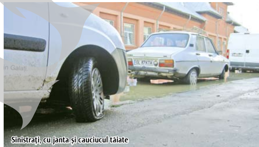
Siniștrați, cu janta și cauciucul tăiate