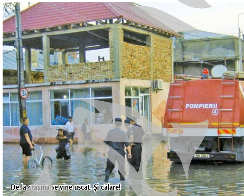
De la crășmă se vine uscat. Și călare!