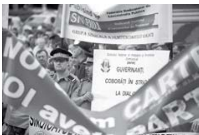
BNS și Cartel Alfa s-au alăturat profesorilor