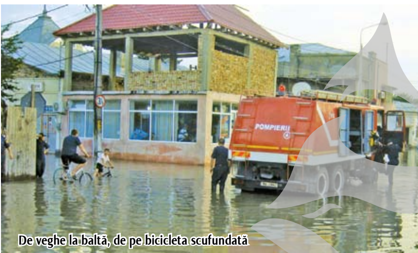
De veghe la baltă, de pe bicicleta scufundată

La ora 21,00, Galațiul era scaldat încă o dată de ploaie și furtună. Cu toate acestea, în continuare nimeni nu ne avertiza că ne-ar paște vreun cod colorat. Dar între asta și balta de afară, apa te trezea mai rapid la realitate.