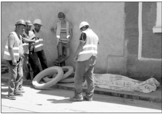
O lumnare lângă trupul muncitorului strivit