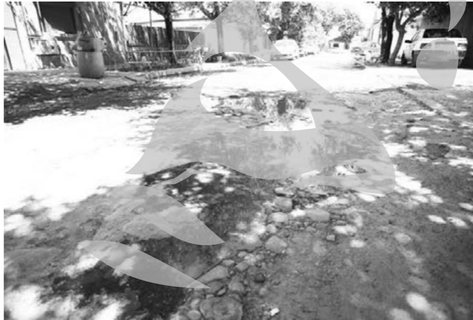
Pe strada Unirii și pe alte 42 de străzi din Galați, evacuarea apelor uzate se face cu ligheanul, în lipsa canalizării

Potrivit datelor furnizate de Primărie, în municipiul Galați sunt 416 străzi. Dintre acestea,