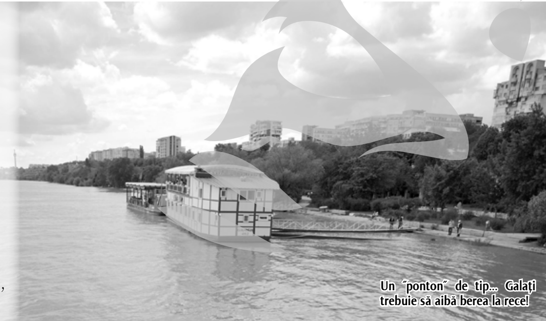
Un „ponton” de tip... Galați trebuie să aibă berea la rece!