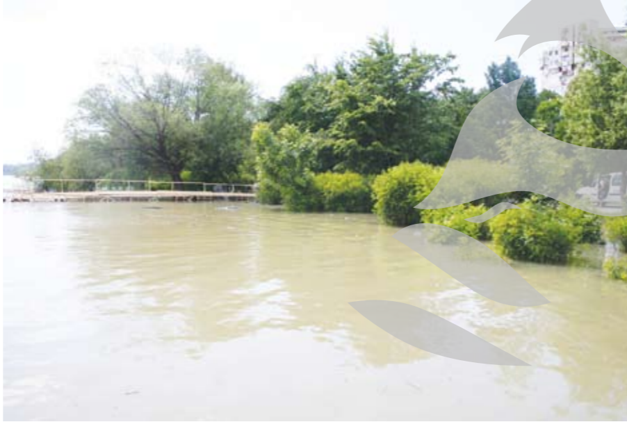
Din ce în ce mai lată, Dunărea nu se lasă și avansează

Înutil de spus că atât i-a trebuit. Măine o s-o țină tot așa.