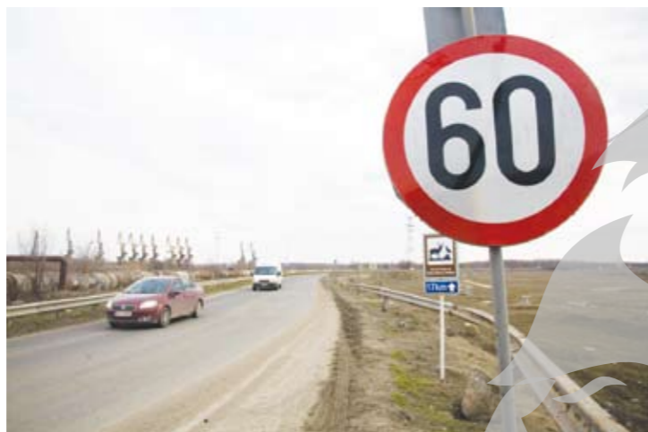
Semnele de restricție sunt deja montate pe DN 22B - Digul Galați-Brăila

► De la 80, la 60 km/h - din cauza creșterii nivelului Dunării