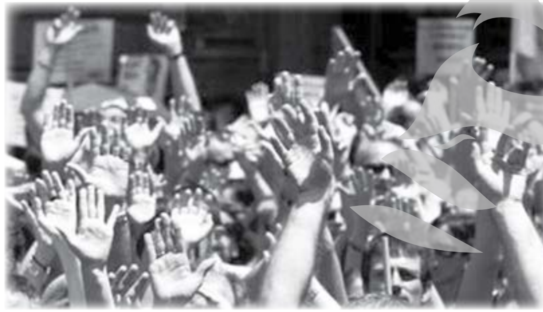
Salvarea din criză este solicitată de mii de europeni prin combaterea măsurilor de austeritate