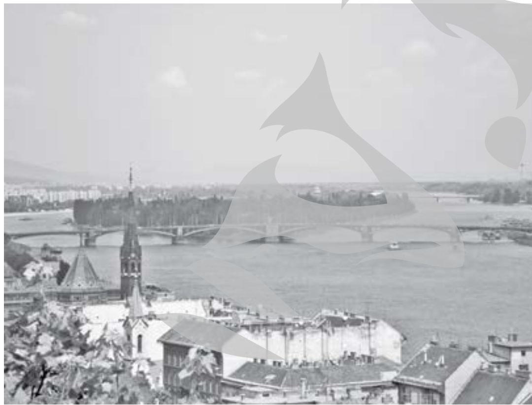
La Budapesta, Insula Margareta atrage mii de turiști!

felul de propuneri de a face din Galați un oraș turistic, integrat în traseele turistice care merg spre Delta sau spre nordul Moldovei. S-a vorbit despre protejarea zonei vechi, de punerea în valoare a portului vechi, iar directorul APDM a încercat să atragă direct navele austriece care fac pe Dunăre călătorii de plăcere. Ideea unei insule de