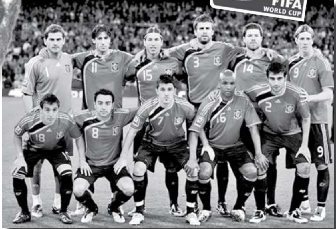
Echipa Spaniei - campioana europeană și una dintre pretendentele la câștigarea Cupei Mondiale...