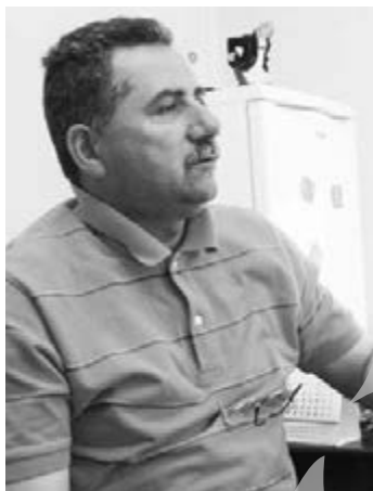
Primarul Gheorghe Bute