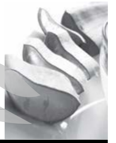
Frunzele de aloe vera