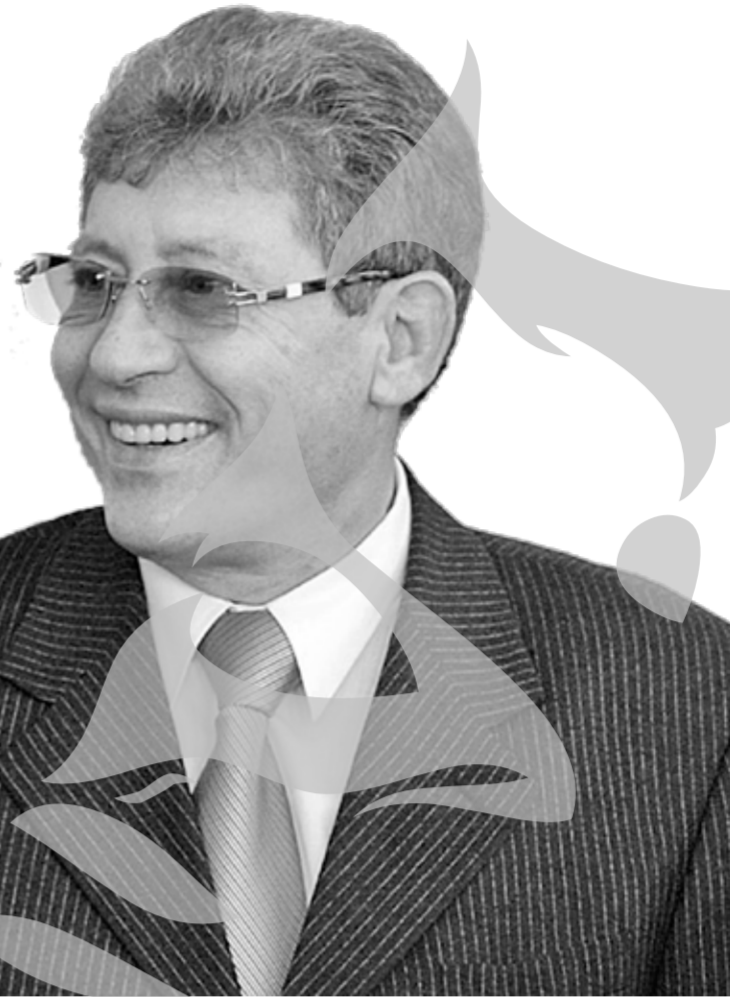
Președintele interimar al Republicii Moldova, Mihai Ghimpu