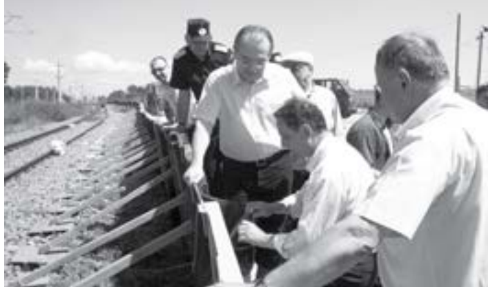
Digul experimental de la Șendreni