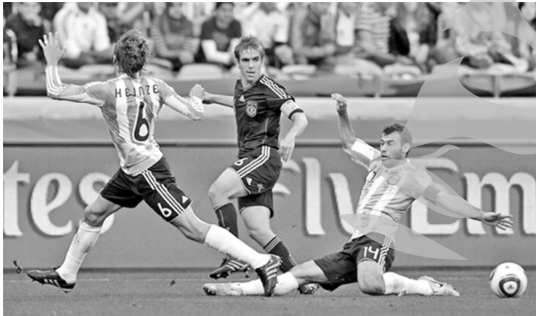
Scorul de 4-0, din meciul Germania - Argentina, va dăinui multă vreme în memoria amatorilor de fotbal...

▶ În semifinalele de mâine și poimâine (după două zile de pauză) vor juca Uruguay - Olanda și Germania - Spania (ambele la ora 21,30, ambele transmise la TVR1).