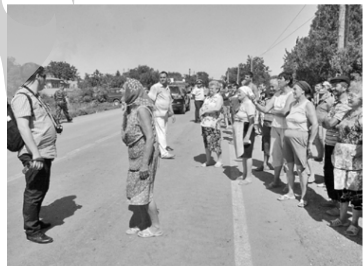
Oamenii din satul Movileni s-au supărat că premierul nu a stat de vorbă cu ei

După ce a plecat din Movileni, câțiva săteni și-au manifestat