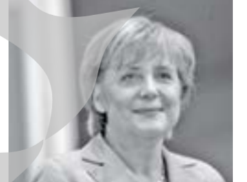
Angela Merkel - un cancelar fericit

* Diego Maradona , selecționerul Argentinei, a