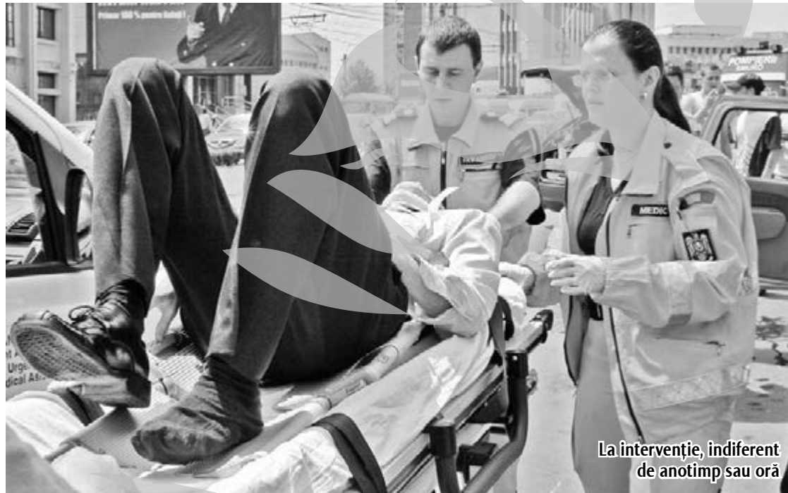
La intervenție, indiferent de anotimp sau oră

Gălățeni, nu uitați: alarmarea falsă a serviciului SMURD poa-