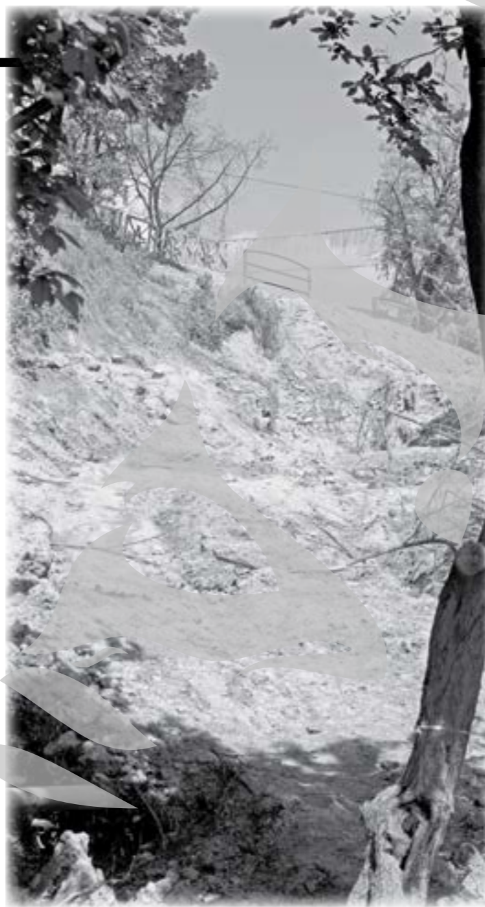
Ce, numai rușii să aibă fum?

Nemulțumit de sancțiunea primită, directorul Ecosalului justifică: „Focul a fost pus. Groapa nu s-a aprins singură, de la căldură. A început să ardă mocnit de marți, de la ora 17.30.