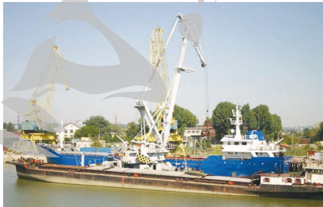
Trafic mai mic în Port Docuri

Mergând strict pe porturile gălățene, valori mai mici ale traficului de marfă față de estimările inițiale s-au înregistrat în Portul Docuri și Port Bazinul Nou. Astfel, dacă în Portul Docuri se miza pe