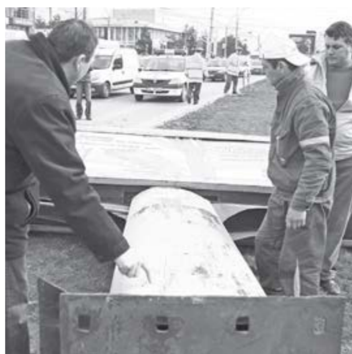
Unul din zecile de panouri puse la pământ