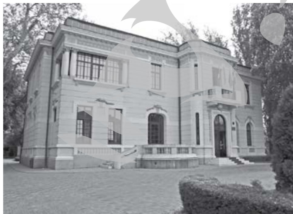
CJ face reduceri și la aparatul propriu