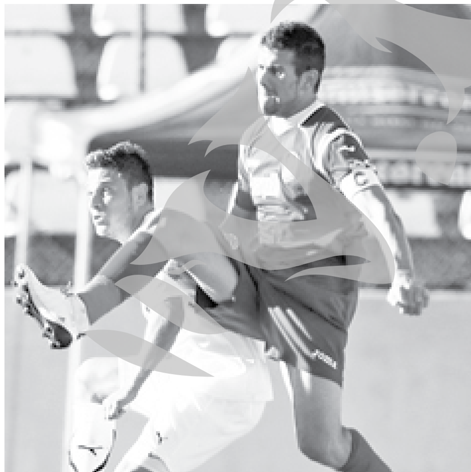
Fază din meciul disputat în Capitală: Sportul - CFR Cluj 3-0

* Pentru înfrângerea din Capitală, clujenii lui Mandorlini au fost... gratulați cu cinci note de 4, cei de la Tg. Mureș „beneficiind” de patru note de 4, aici înscrindându-se și primul autogol din acest sezon (Topici). Deosebit de dură a fost catalogată prestația celor din Vaslui: 11 jucători fiind notați cu 5, iar doi cu 4, în timp