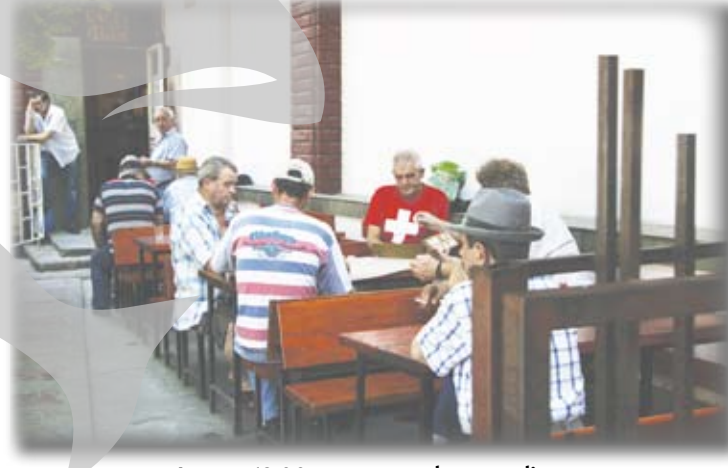
La ora 12,00, toate mesele sunt pline

bar se mai dă pe datorie, asta-i. Întreb un vânzător (despre chelneri nu poate fi vorba, pentru că aici toată lumea merge la bar pentru încă un rând) dacă se simte criza în cârciumă. „Păi, la noi e criză tot timpul, dom’le, că la noi nu plătește nimeni. Toți beau la caiet, iar noi încasăm o singură dată pe lună”, recunoaște vânzătorul. Cu greu scoatem ceva cifre de la el, dar admite totuși că afacerea merge bine. Clienții sunt fideli și, de obicei, nu sunt serviți decât cei care au un istoric bun al returnării creditului pentru alcool. Și de ce nu ar merge? Cererea de băutură e mai mare pe timp de criză, când mușterii se îngărmădesc să își verse amarul într-un pahar de lichid cu grade. Au timp liber mult, pe care