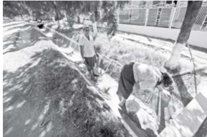
Așa se muncește pentru venitul minim garantat

Și totuși, n-o să vină să credeați! Cu hainele impecabile, chiar dacă se spală la lighean, unele soațe de „italieni” de Rediu au mașină de spălat acasă! Totul este să aducă destulă apă și cu soțul în Italia, te înveți să plătești.