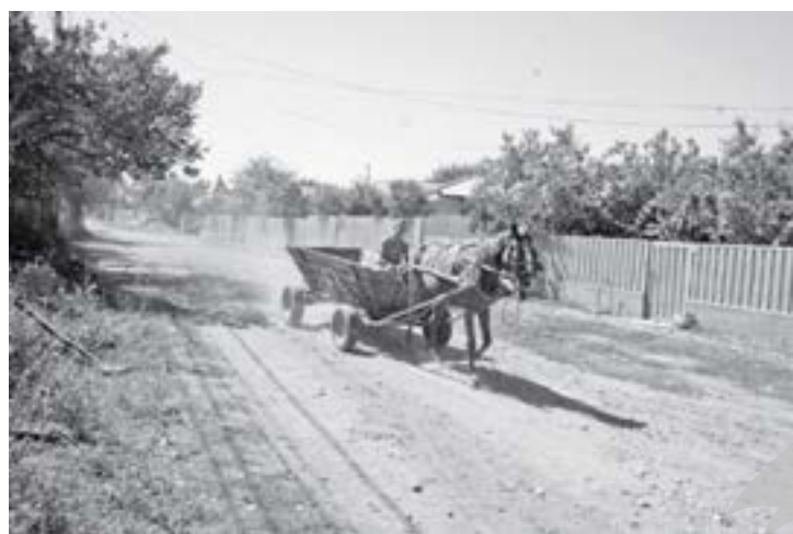
Calul nu poluează...