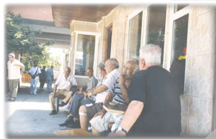
Aliniați, în așteptarea licorii

nomică, ce pare să nu se mai sfârșească. Probabil că și cârciumile de cartier sunt afectate, dar, după cum arată în plină zi, după cât de pline sunt chiar și pe căldura cea mare, n-ai spune că ies în pierdere. Oricât de amară ar fi viața, oricât de multe necazuri ar avea, oricât de puțini ar fi banii, cârciuma e locul pe care nu îl scoți nicide-