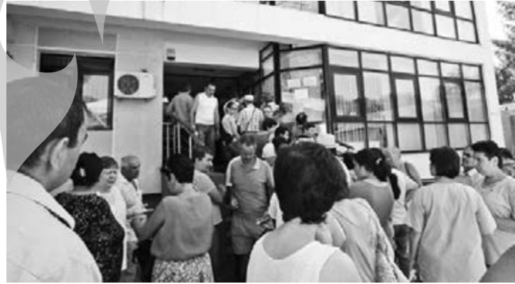
Cum modificarea s-a... schimbat pe ultima sută de metri, gălățenii nu au știut și au stat la coadă, la Sănătate, degeaba

După ce au stat la cozi la Casa de Pensii, după ce au fost trimiși să își cumpere dosare, au revenit la coadă și au plătit și contribuțiile de la Șomaj și au aflat că la Sănătate nu trebuie să plătească, momentan, nimic, cei care încasează veniturii din activități independente au plecat, sfârșiți, spre casă (asta dacă și-au luat o