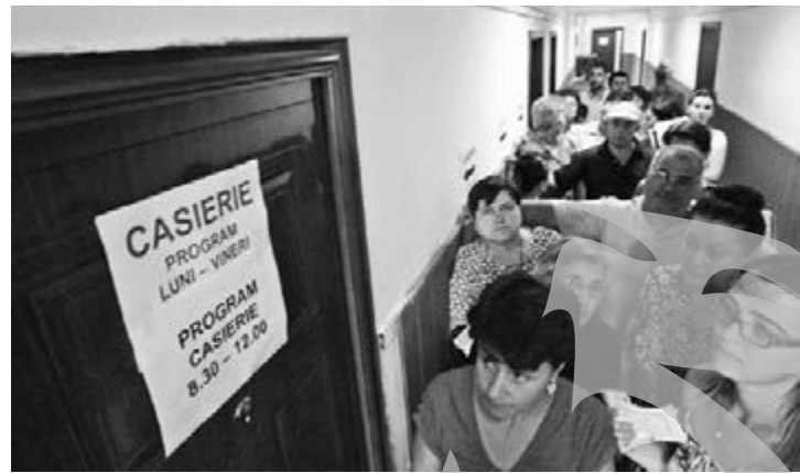
Programul stabilit inițial la Casa de Pensii a fost prelungit, ulterior, în funcție de numărul cetățenilor care au stat la coadă

de Pensii, cei vizați de Ordonanța 58/2010 au plecat mai departe, la Șomaj. Aici, alte cozi, alți nervi. Mulți au avut și surpriza neplăcută să afle că au nevoie și de un dosar – cu șină! – pentru a putea depune declarațiile. „Mi-au spus că trebuie să am dosar în care să pun o copie după buletin, o adeverință cu venitul și formularele. Mai mult decât atât, am înțeles că nici măcar nu ne dă un formular înapoi să avem și noi dovada că am depus în termen. Mai bine mă duc și le depun la poștă, că așa am și confirmare”, ne-a explicat o doamnă aflată la coada de la AJOFM.