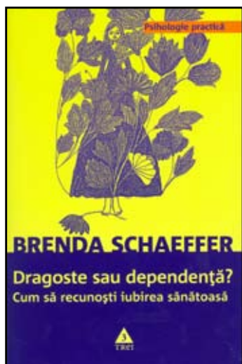
La întrebarea ce constituie titlul acestei cărți, răspunsul au-