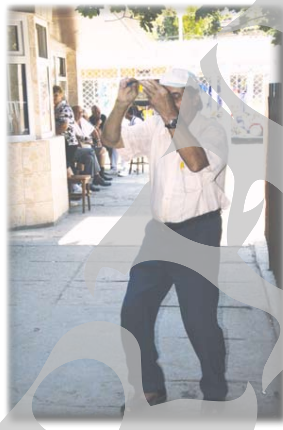
Pentru o bancnotă, de țigări, omul dansează în fața camerei

leri la prânz, când majoritatea ori muncea, ori își făcea siesta, la barurile și terasele din zona pieței din Micro 19, undeva ascunse de trecătorii de pe Aleea Comerțului,