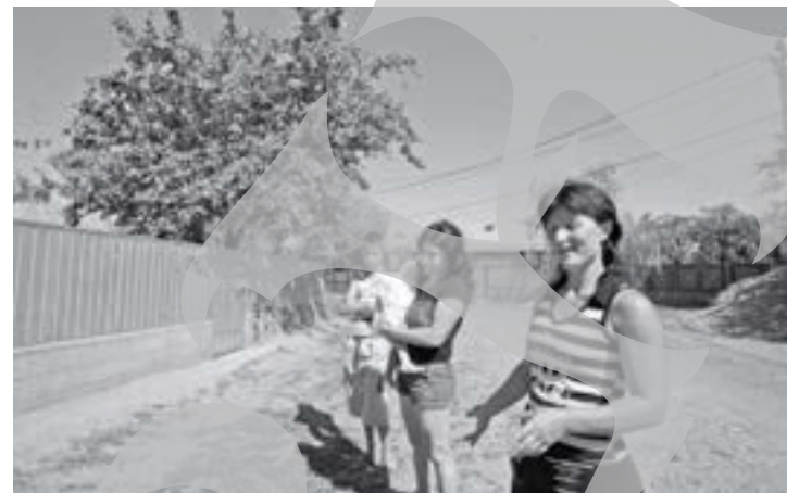
Tineretele "italiene" ne-au fost interlocutoare curajoase