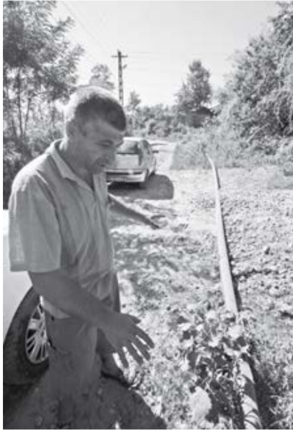
Conducta de apă așteaptă viitorii bani pentru șanț