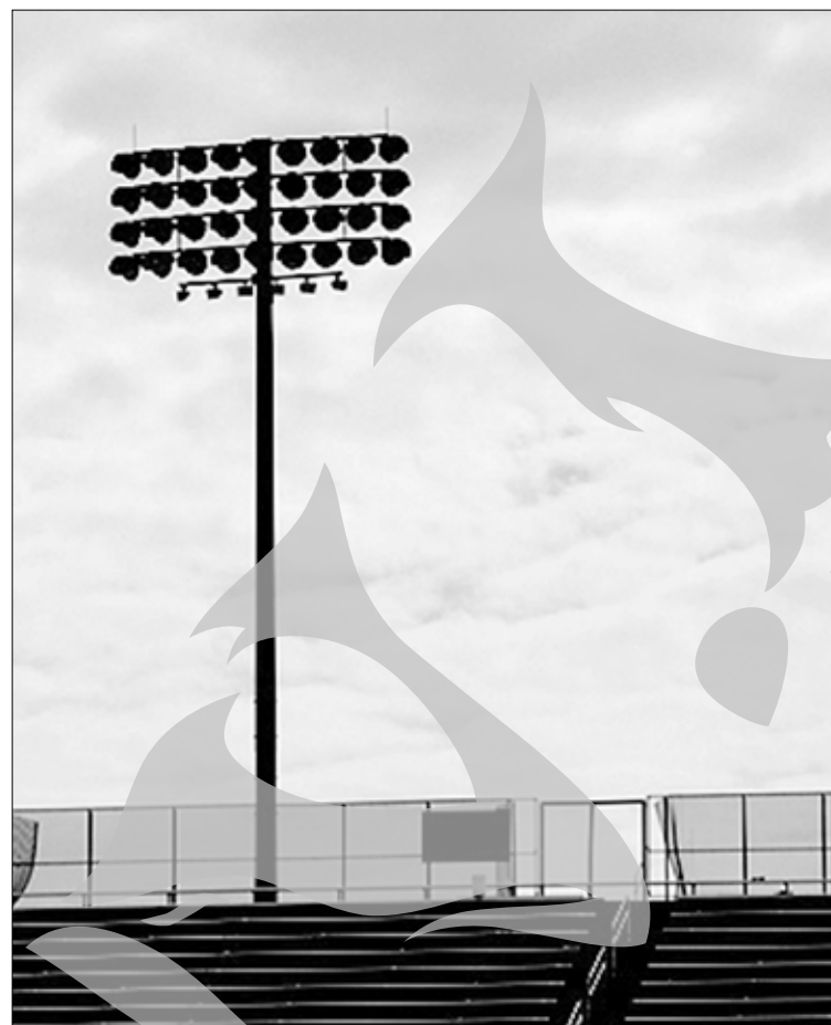
Pe Stadionul "Oțelul" se vor aprinde becurile cam cu zece zile înainte de sosirea lui Moș Crăciun

Mulți dintre suporterii dunăreni susțin că, până nu vor vedea măcar un stâlp ridicat, nu vor lua