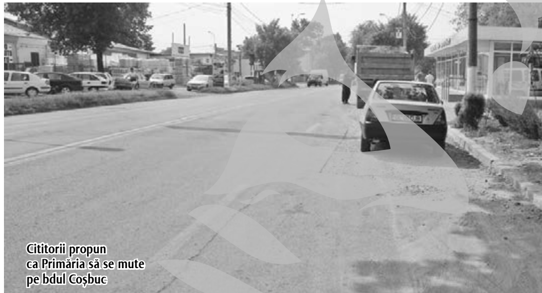
Cititorii propun ca Primăria să se mute pe bdul Coșbuc

Din această cauză, foarte mulți gălățeni care locuiau pe această stradă și-au vândut casele și au plecat care încotro a văzut cu ochii, iar alții se gândesc să o facă de acum încolo. În alte orașe din țară, asemenea societăți – spălătorii auto, vulcanizări primesc autorizație de funcționare în afara orașului, la Galați, însă sunt oare alte legi?, oare așa să fie normele europene? Nu cunosc, poate ne răspunde domnul primar Dumitru Nicolae și domnul Mihai