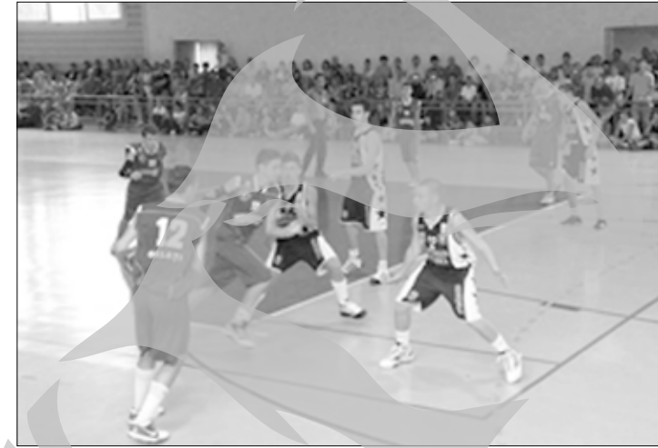
Fază din meciul Phoenix LPS - CSS Viitorul Mobitelco Cluj (scor 61-51), succes care a adus gălățenilor titlul de campioni naționali