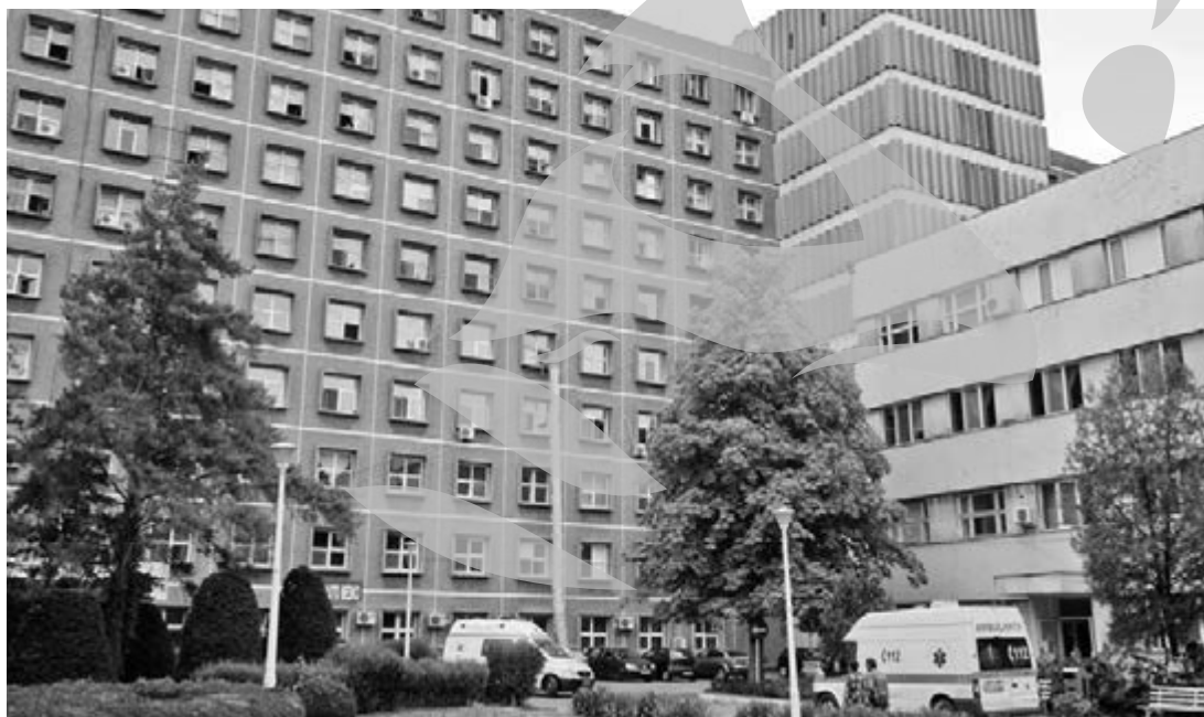
Spitalul Județean i se vor plăti datoriile istorice