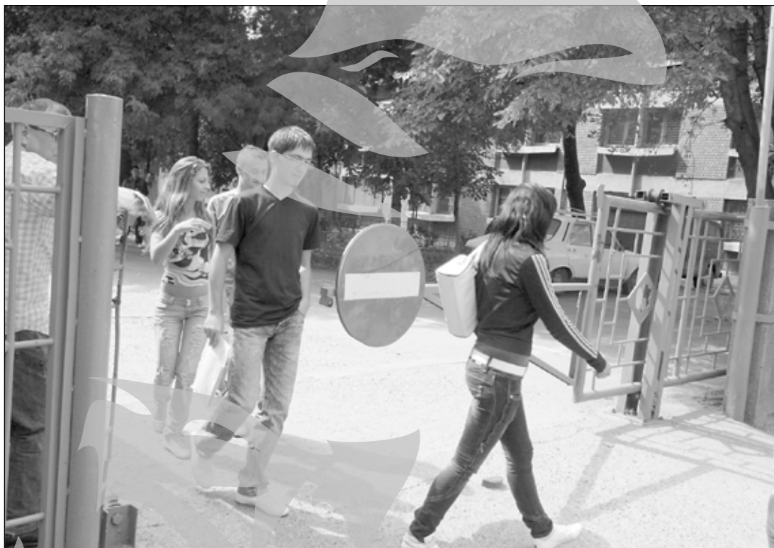
O sesiune cu probleme

Șase elevi au lipsit la a doua susținere a probei