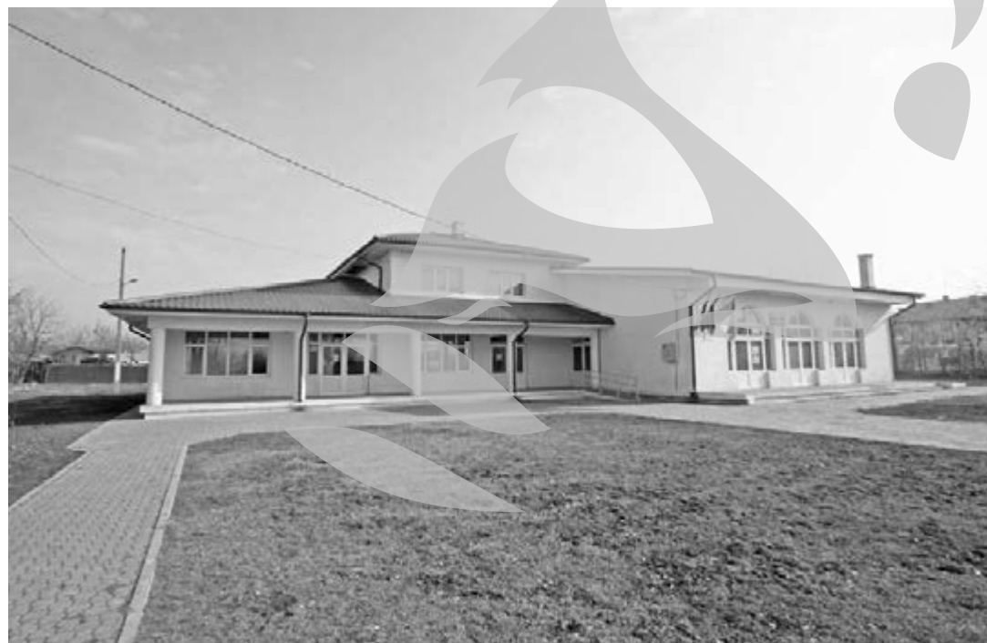
Modernul cămin cultural, ridicat tot cu ajutorul francez

La 22 septembrie 1994 s-a semnat primul acord de înfrățire din județ, între comuna Costache Negri, cu peste 2.700 de locuitori, și orașul de peste 50.000 de locuitori La Roche Sur Yon, din Regiunea Pays de la Loire, din nordul Franței. Francezii au propus atunci Consiliul Județului