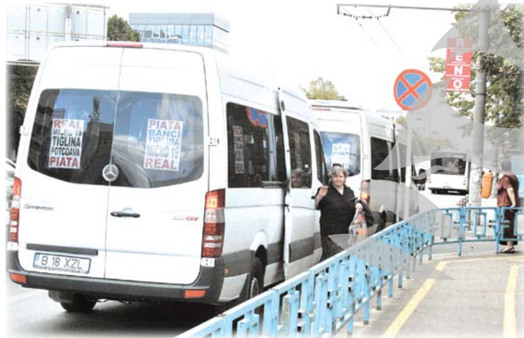
Pasagerii sunt nevoiți să coboare direct în stradă