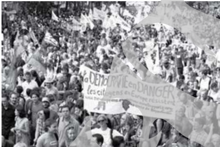
Demonstrație la Paris

≡ Sâmbătă, în mai multe state europene au avut loc manifestații împotriva expulzării romilor ≡ Un protest asemănător este anunțat pentru astăzi la București