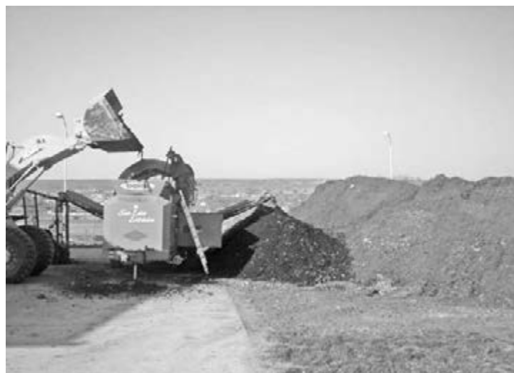
Sub cerul liber, o valoare de Umbrărești: semicompost cu humus pentru lalele, mere și roșii ecologice

Ne-am informat pentru dumneavoastră Permisul de portarmă - acte și taxe necesare