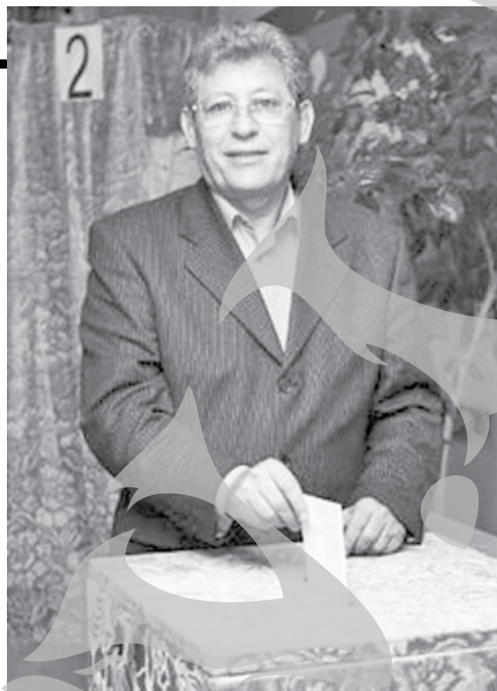
Președintele interimar al Republicii Moldova, Mihai Ghimpu, la vot

Seismul cu magnitudinea 7, unul dintre cele mai violente din istoria Noii Zeelande, care a afectat în noaptea de vineri spre sâmbătă orașul Christchurch, al doilea din țară, a provocat distrugerii masive și rănirea mai multor persoane. Treziți în cursul nopții (1.35), locuitorii au ieșit panicați din case, rămase fără curent, descoperind pe străzi fațade prăbușite ale unor clădiri, mașini zdrobite și conducte de gaze rupte. Seismul a avut cinci replici, una dintre acestea având magnitudinea tot de 7.