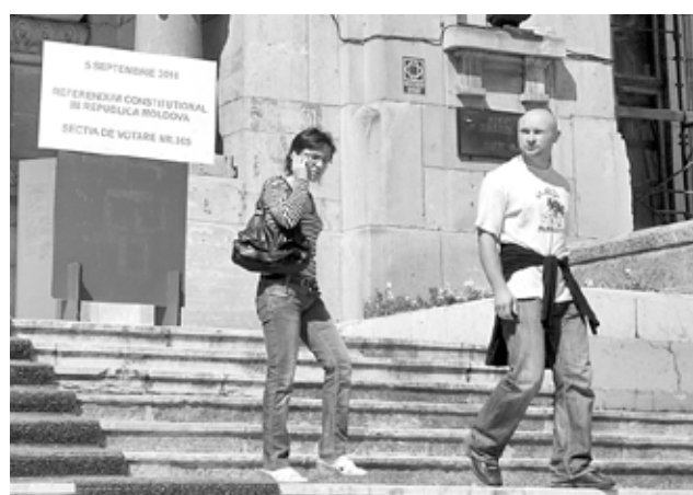
Secția de votare nr. 365 din Galați