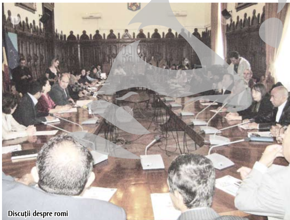
Discuții despre romi

Multe s-au spus ieri. Iată, în județul Galați nu sunt romi expulzați din Franța - au confirmat reprezentanții tuturor comunităților de romi. Deci, ai noștri s-au legat de glic... Neașteptat, am aflat că în