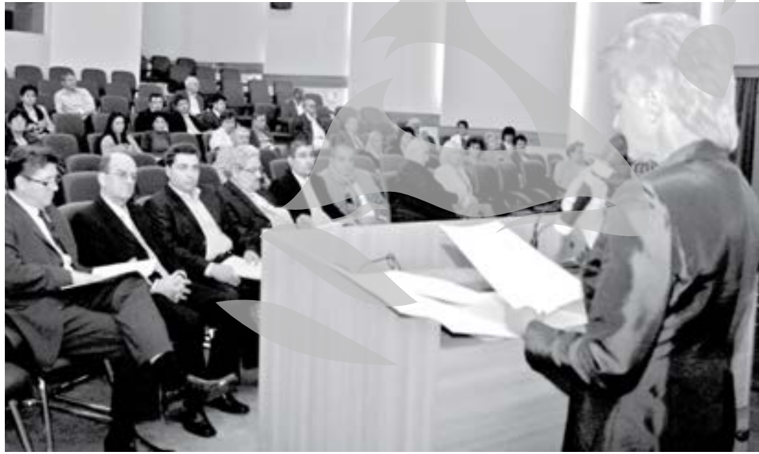
Dezbaterea contabililor gălățeni

În acest context, contabilii rămân cea mai populară sursă de consultanță externă și de suport pentru IMM-uri. Pentru a înțelege rolul practicilor mici și mijlocii (PMM-uri), din care acești contabili fac, de regulă, parte, în furnizarea de consultanță de afaceri întreprinderilor mici și mijlocii (IMM-uri), este importantă stabilirea contextului general.