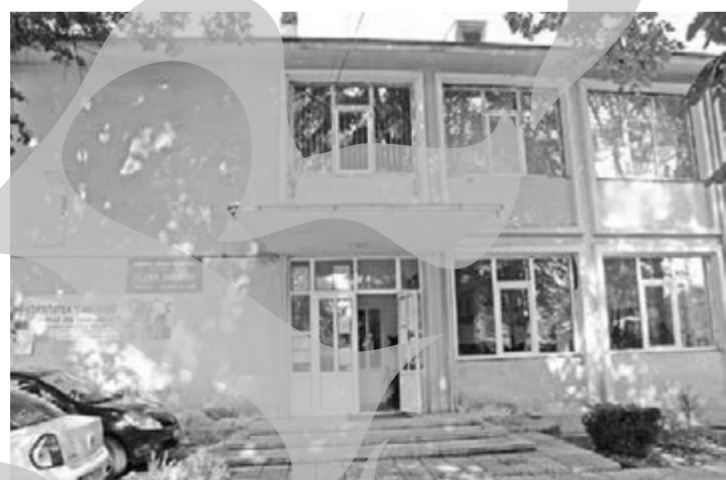
Unde sunt banii părinților elevilor de la Școala Nr. 5 Tecuci?