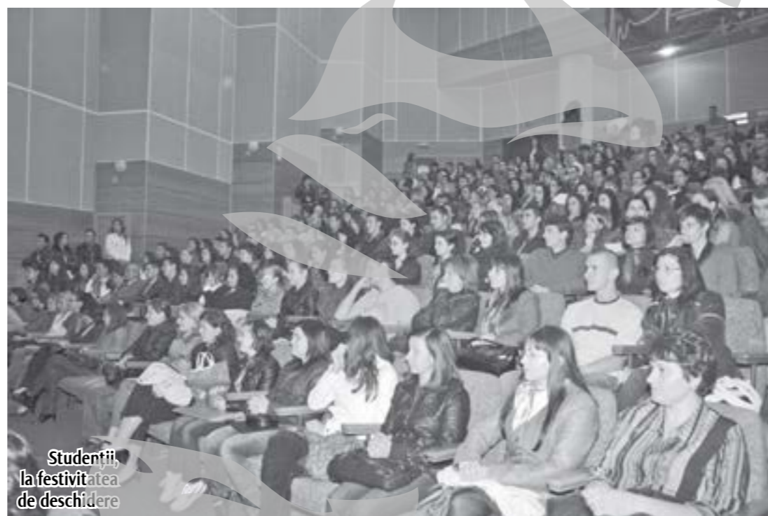
Studenții la festivitatea de deschidere