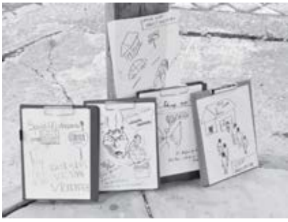
Materiale pe tema prevenirii furturilor din locuințe și mașini