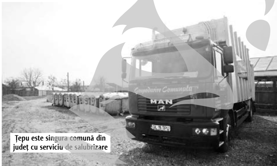
Țepu este singura comună din județ cu serviciu de salubritate

Campionul amenzilor în luna care s-a încheiat este, însă, o societate comercială din comuna Tudor Vladimirescu, al cărei administrator a refuzat să-i primească în control pe cei de la Garda de Mediu. Refuzul acestuia l-a costat nu mai puțin de un miliard de lei vechi.