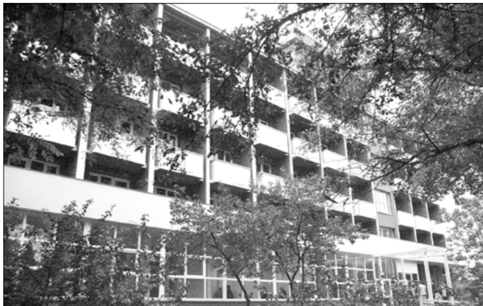
Căminul „Sf. Spiridon”

APIA Galați Scheme de ajutor în agricultură