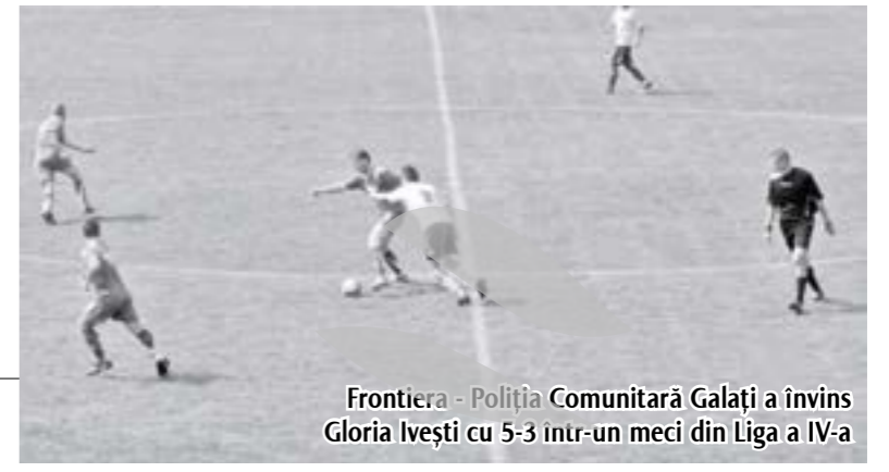
Frontiera - Poliția Comunitară Galați a învins Gloria Ivesți cu 5-3 într-un meci din Liga a IV-a