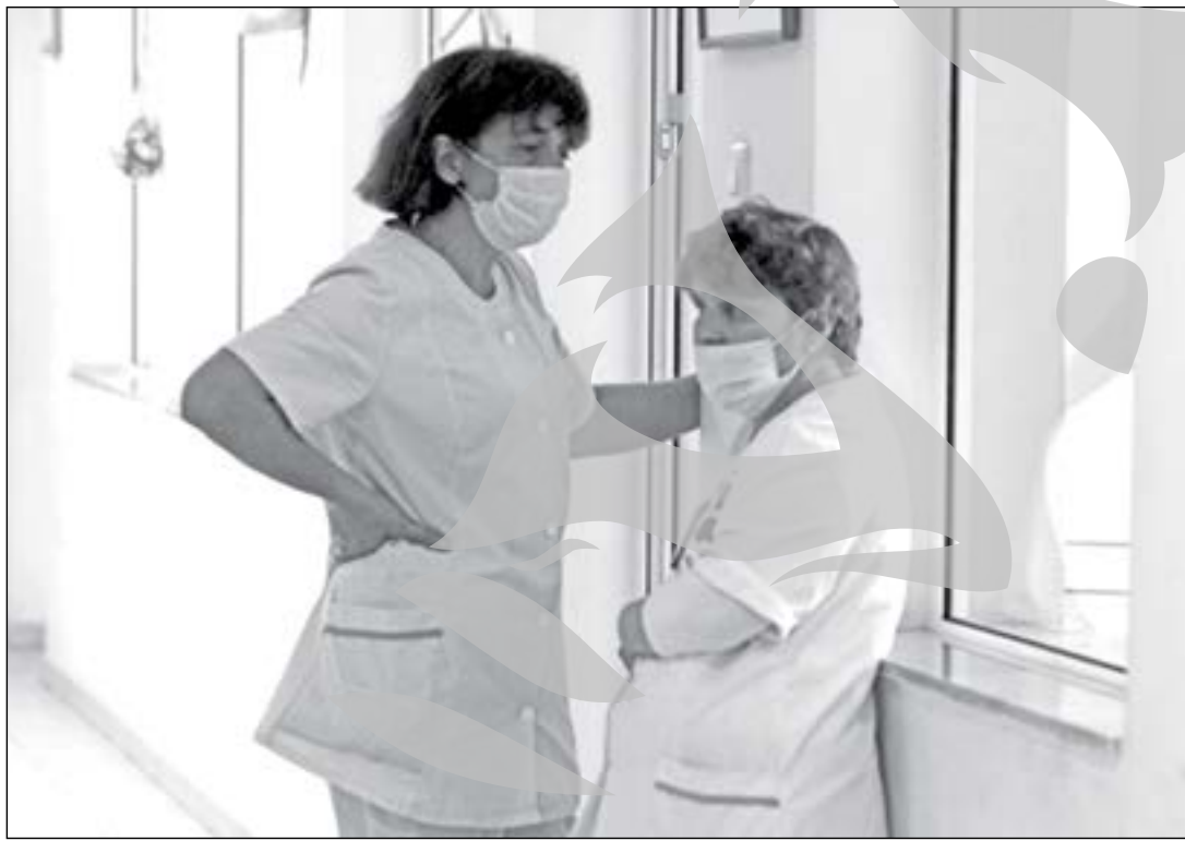
Cadrelle medicale au anunțat că vor organiza proteste

Aproximativ 160 de spitale din Bulgaria, adică peste jumătate din numărul total, au dat în judecată Fondul Național pentru Asigurări de Sănătate, pentru întârzieri în plata datoriilor, estimate la 150 de milioane de leva (76,7 milioane de euro), a anunțat Asociația Medicală, citată de Novinite.com. Nicio plată nu a fost efectuată pentru luna august, iar în perioada mai-iulie spitalele au primit doar 80 la sută din sumele datorate. Sumele cerute drept despăgubire în justiție sunt simbolice, deoarece spitalele nu își pot permite să plătească taxele judiciare pentru a cere compensații mai mari. Spitalele din toată țara și-au redus operațiunile, amânând intervențiile chirurgicale programate și cerându-le pacienților să-și aducă singuri mâncare. Furnizorii de medicamente și echipament au avertizat că vor înceta livrările. Medicii sunt dispuși să protesteze în stradă în cazul în care cererile lor nu sunt satisfăcute, în condițiile în care parlamentul bulgar urmează să voteze noul candidat pentru postul de ministru al Sănătății și o moțiune de cenzură depusă de opoziție pe tema politicii de sănătate.