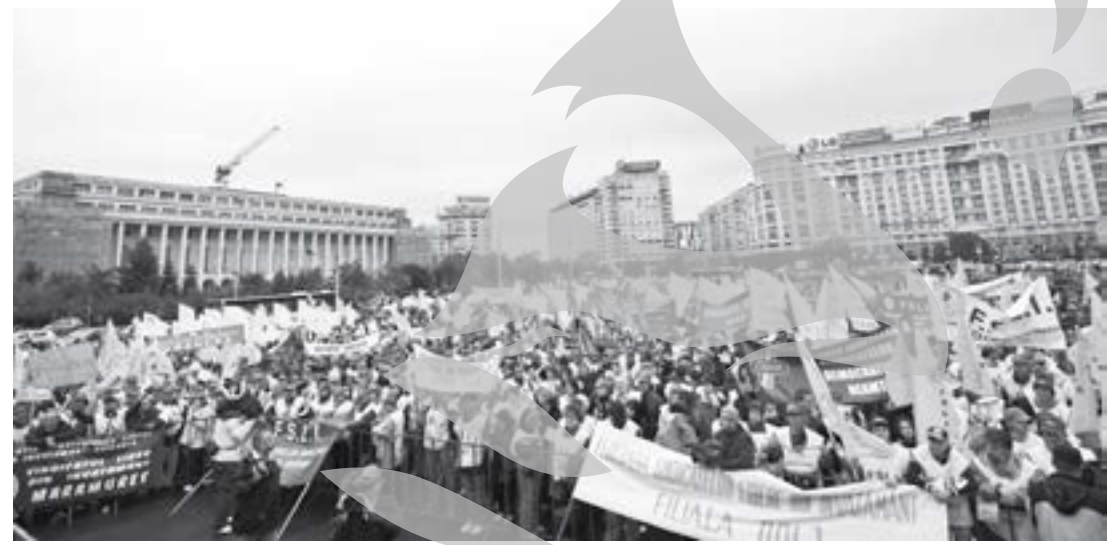
Sindicaliștii FSLI, strigându-și nemulțumirile în fața Guvernului

Pe de altă parte, aproximativ 1.500 de cadre didactice afiliate la Federația Educației Naționale (FEN) și "Spiru Haret" au protestat la Palatul Cotroceni, începând cu ora 12.30. Și aceștia au cerut salarii decente și stoparea disponibilizărilor din sistemul educației. Protestatarii au avut bannere cu însemnele sindicatelor la care sunt afiliați și caricaturi cu președintele Traian Băsescu și premierul Emil Boc. Pe bannere se puteau citi și mesaje în versuri: "Vine iarna cea geroasă/ Noi stăm chirchiți în casă/N-avem bani, n-avem mâncare/Vouă ce vă pasă oare". Sau: "Muncitori, sclavi în propria țară", "Salarii de 600 de lei. Cum se poate trăi?" și "Ne-mprumutăm, dar cine plătește? Tot sclavii". Protestatarii au stat într-un perimetru împrejmuit de garduri și un cordon de jandarmi. Aceștia i-au dedicat președintelui Traian Băsescu o broșură numită "Omagiu", în care îi amintesc de promisiunile făcute din 2004 până în prezent și, deși au promis să nu scandeze, au cerut demisia acestuia.