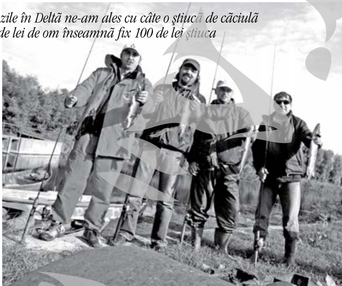
De la stânga la dreapta, fraier - știucă de un milion, fraier - știucă de un milion, fraier - știucă de un milion, fraier - știucă de un milion

În primele trei ore, mai mult ne-am plimbat și am admirat stuful și nufierii (locuri într-adevăr superbe) pentru că de prins nu am prins decât o știucă la un kilogram și un biban amarât. Pe la prânz deja ne pierdusem orice speranță că vom mai prinde ceva, așa că aruncam mai mult în dorul leii. „Sigur își schimbă dinții”, glumeam amar. „Da, și-au găsit tocmai azi să își facă programare la stomatolog”. Deh, ghinion curat. Și, ca să ne asigurăm că nu e de la noi cumva, am mai întrebat și alți pescari cără dăduseră cu banii în știuci. La fel de prost: una singură în câteva ore de măturat balta. „Mă, dacă ne întrebă cineva ce am făcut în Delta spunem și noi că am tras niște iarbă”, mai încercăm o „arogață” care să ne mențină spiritul treaz. Că doar asta și făcusem: o grămadă de vegetație se agățase în cârligele noastre. Doar nu v-ați gândit la altceva. Și, deodată, parcă începe să se dezmoarte. Să fi fost ora, să fi fost locul, nu știm, dar am luat trei bucăți în două minute, am mai ratat două. Și gata! Iar s-a lăsat plicșeala pe lansele. Patru inși, patru știuci.