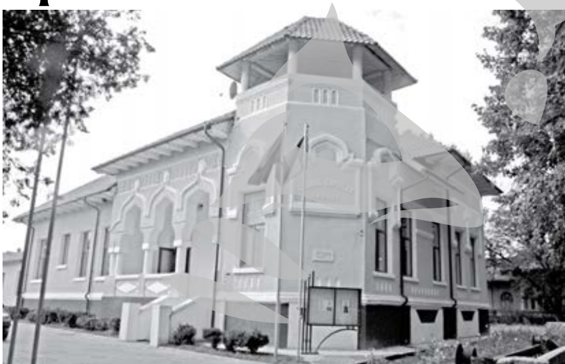
La Clubul Copiilor din Tecuci, profesorul sfințește locul

Copiii de ciclul primar vor resimți la fel de mult dispariția cursului de informatică. „De obicei, la cerc veneau copiii de cla-