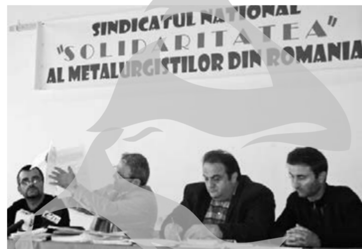
Vechea conducere a noului sindicat

Dincolo de motivul extinderii... naționale a mișcării sindicale reprezentate de către Tiber, acesta a spus și că în felul acesta procesele pe care vechiul sindicat le are cu gruparea Ilinca, despre care a spus că este susținută de conducerea ArcelorMittal Galați, rămân fără obiect. În plus, potrivit liderului, încrederea în justiția gălățeană i-a determinat pe cei din conducerea