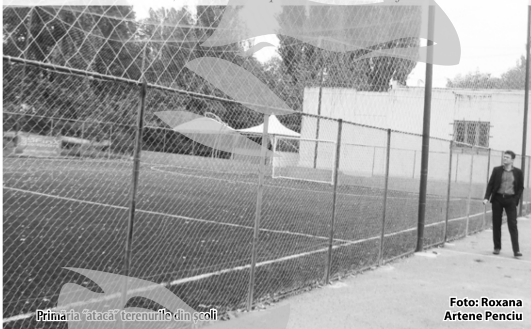
Primăria „făcă” terenurile din școli

„Unii proprietari de gazon artificial sau de sală de sport tip balon ne-au declarat că au depus de câteva luni bune documentația pentru obținerea autorizației, dar dosarul nu le-a fost aprobat, pentru că școlile nu aveau terenul intabulat” Intabulare pe care trebuia s-o facă Primăria