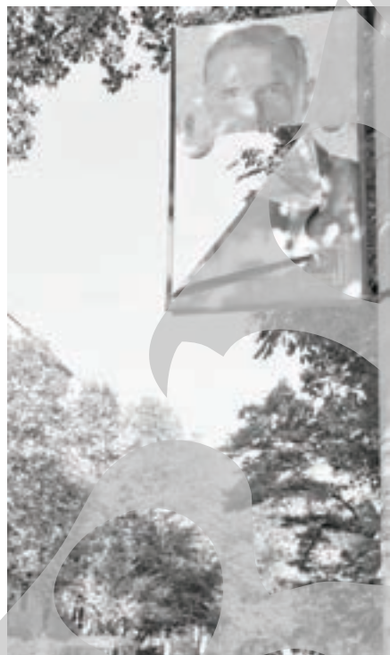
Cine l-a decapitat pe Geoană?