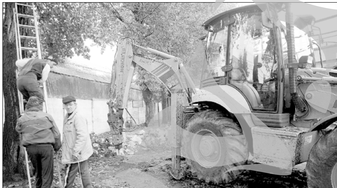
Fundația primului stâlp de nocturnă va fi realizată în punctul de nord, nord-vest al Stadionului "Oțelul"

De ieri au început săpăturile la stadionul din Țiglina III pentru ridicarea instalației de nocturnă. „Stai, nene, nu ne face poze acum, ci la finalul lucrărilor”, s-au ferit reprezentanții firmei Marmet Construct, care vor realiza fundația acestei investiții de aproximativ 700.000 de euro