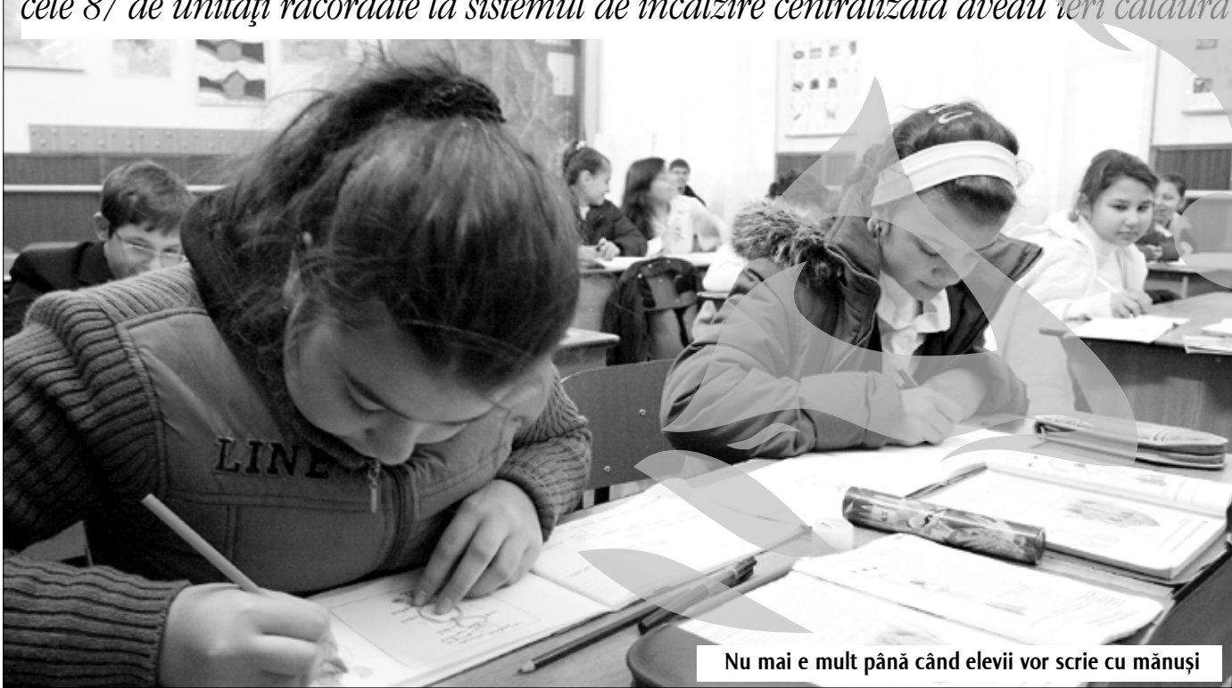
Nu mai e mult până când elevii vor scrie cu mânuși

Noroc că avem căldură sufletească, spun cadrele didactice Doar 30 din cele 87 de unități racordate la sistemul de încălzire centralizată aveau ieri căldură