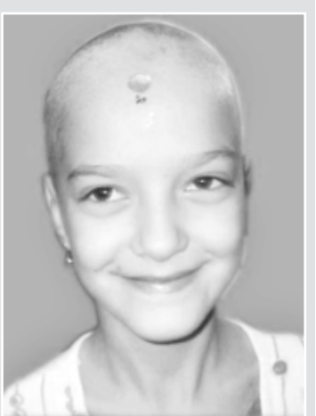
Dupa un an și o primă operație, fetița-soare este în plin tratament citostatic și așteaptă următoarea intervenție medicală