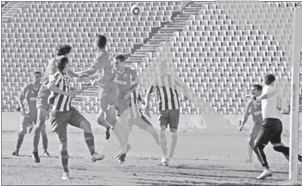
Verva dunărenilor a fost concretizată prin patru reușite la zero