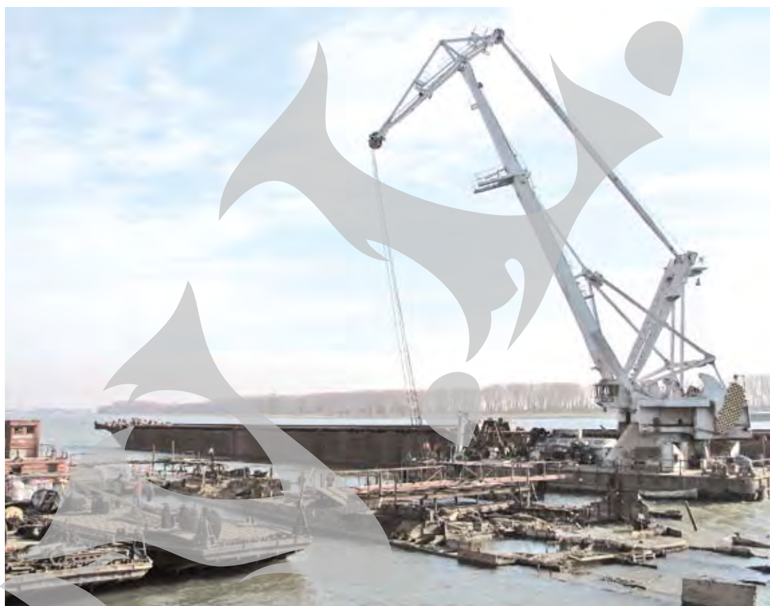
Instantaneu din timpul lucrărilor de ranfluare