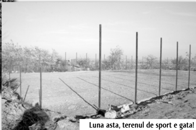
Luna asta, terenul de sport e gata!

Primarului nu-i mai place să vâneze, dar nu renunță la pușcă. Aici se vânează iepuri și porci mistreți, dar nu vin străini cu bani, ca