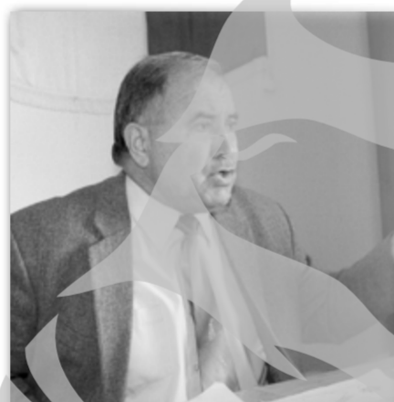
Primarul Drujescu are model de oraș

Deșiorășean la bază, primarul crește animale de curte cu mâna lui și