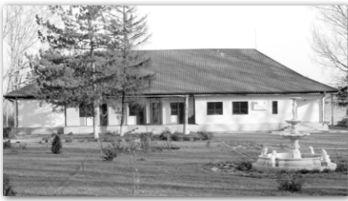
Centrul transfrontalier pentru Mediu al Consiliului Județului pare pustiu...