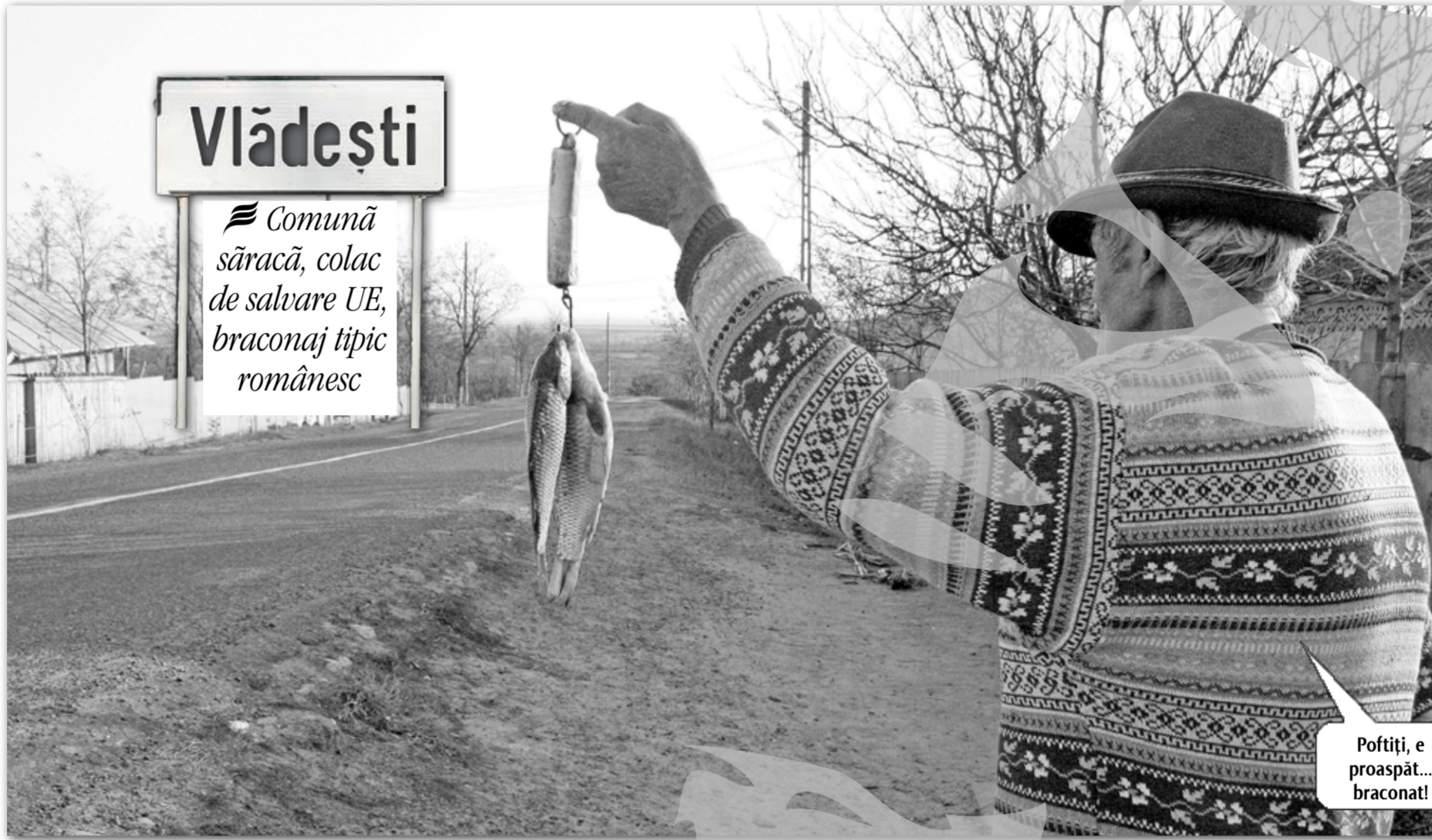
Poftiți, e proaspăt... braconat!

Polul braconajului Cele mai multe furturi din județ