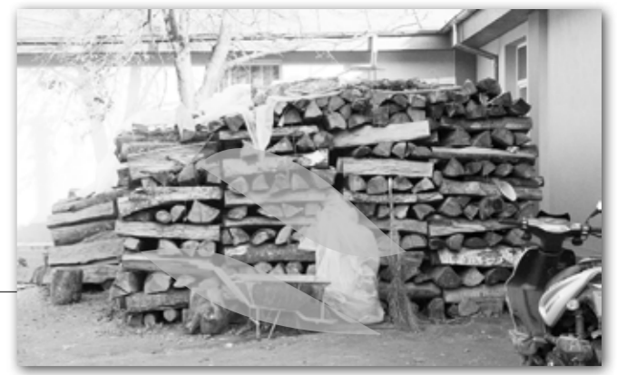
Lemnele pentru încălzirea școlii sunt pregătite