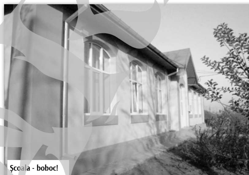
Școala - boboc!