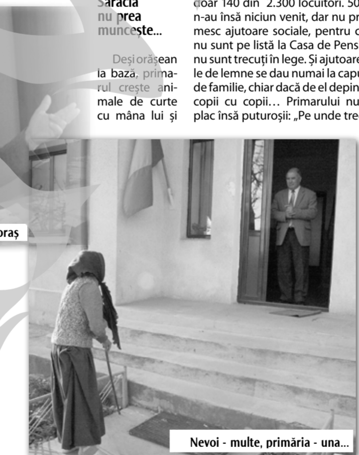
Nevoi - multe, primăria - una...

Comuna are „o grămadă de oi!” Are și pământ arabil bun, dar „s-au găsit câțiva șmecheri care au luat pământuri în arendă. Legea ține cu arendașul! Fiind și zonă defavorizată, iau și 160 de euro pe ha, dar îi dau numai 300 kg de grâu proprietarului. Iar el își ia combine, tractoare, pe banii oamenilor! Își bate joc! La Vânători