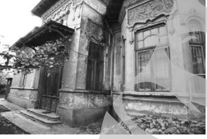
Casă-monument istoric, trecută prin trei incendii proaspete

Șapte familii locuiesc în clădirea de patrimoniu din strada Gării numărul 53. Dintre aceștia, patru sunt chiriași ai Primăriei,