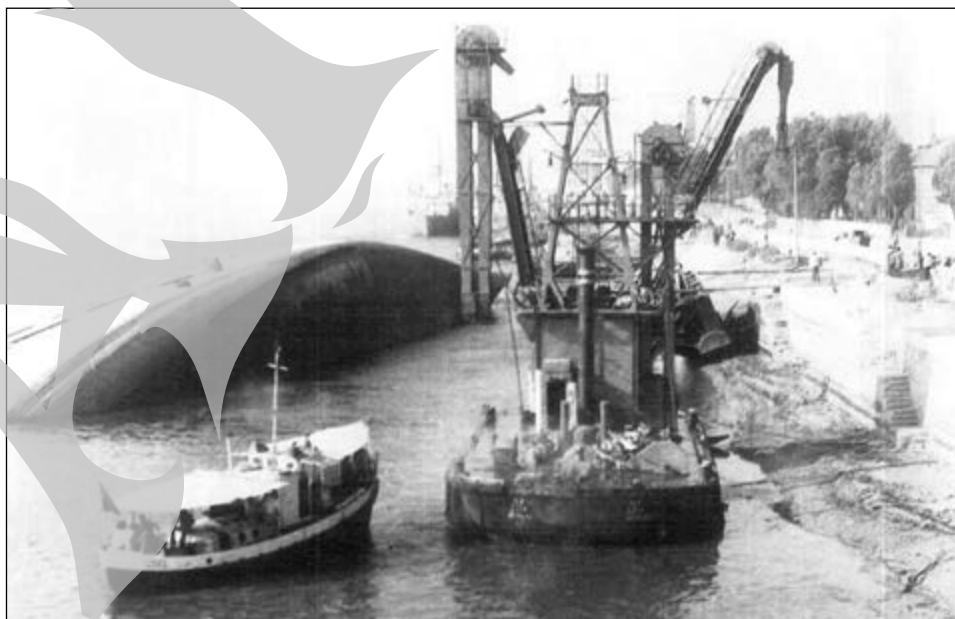
Nava scufundată în Portul Comercial