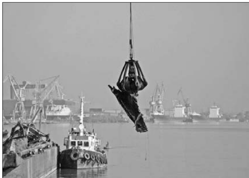
Ultima bucată din „Transilvania” este scoasă din apă