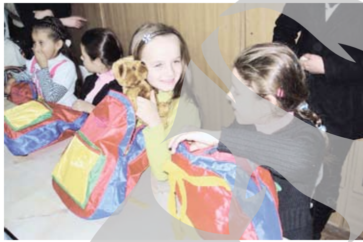
Bucurie fără cuvinte