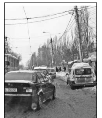
Duminică relaxată în trafic; luna însă nu se anunță la fel

Circulăm omeneste prin oraș, dar să nu ne sfidăm norocul. De luni, se anunță îngheșuală mare într-un trafic plin de zăpadă. Ca să evite problemele, șoferii sunt îndemnați prietenește să redevină – pentru o zi – pietoni. Comisarul Viorel Cojocaru, purtătorul de cuvânt