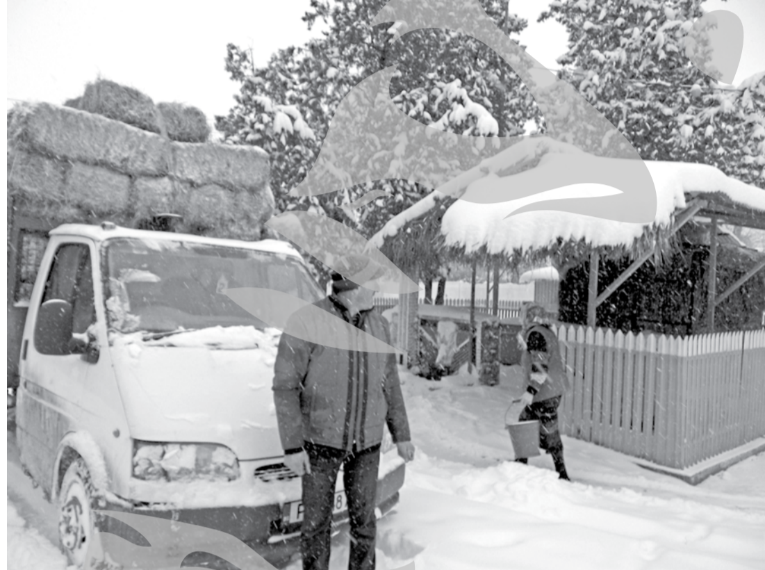
La Berești, omăt din belșug, cât pentru două ierni

Tot de-ale iernii. În Berești-sat, anul 2011 a început sub auspicii rele. Se poate bandă rulan-