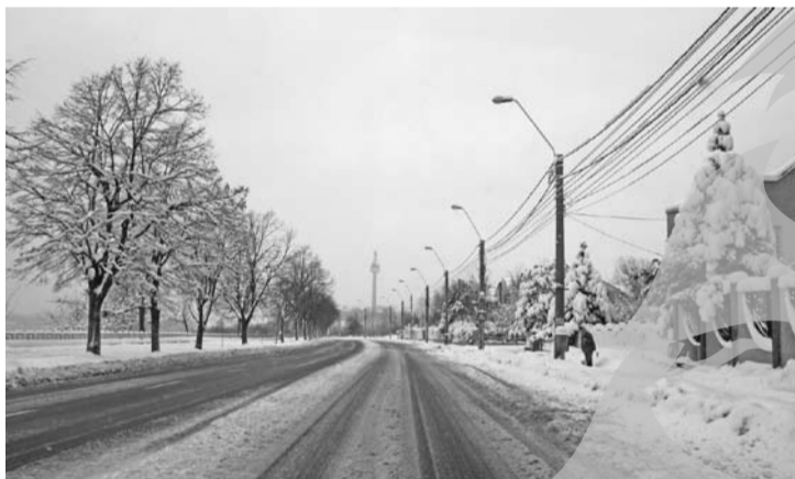
Faleza, curată ca vara (ok, exagerăm)

► Să nu le fie de deochi! ► Nici urmă de vechiul refren "Iarna ne-a prins nepregătiți"