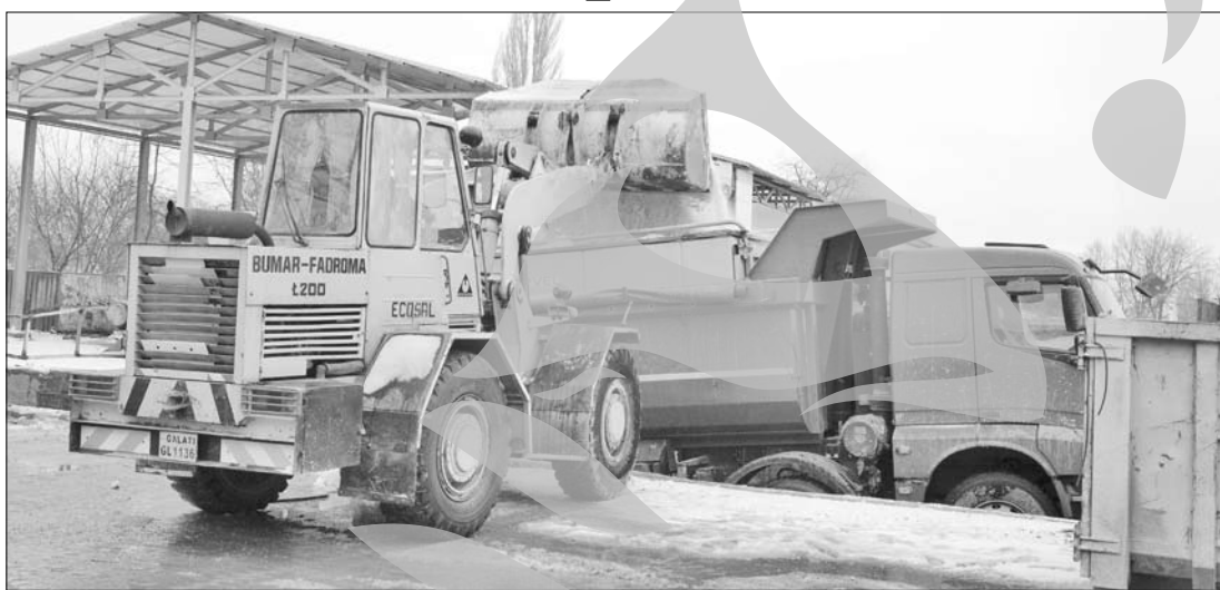
Zăpada trece, urmează gheața

de îngreunează acțiunea de deszăpezire, dar și celor care au degajat trotuarele. Este important să curățăm acum zăpada, pentru că va urma o perioadă cu ger și nu vrem ca Galațiul să se transforme într-un patinoar. Pe de altă parte, le reamintesc tuturor că cei care nu curăță de zăpadă și gheață trotuarele din fața caselor și a instituțiilor în care muncesc riscă amenzi. Dimineață, Poliția Locală a dat doar avertismente, dar de după-amiază se vor aplica și amenzi”, a declarat viceprimarul Ciomacenco. Potrivit HCL 307/27.07.2006, pentru „neîndeptarea zăpezii și gheții de pe trotuare, acoperiș și din fața imobilelor în care locuiesc sau își desfășoară activitatea”, gălățenii riscă amenzi cuprinse între 100 și 500 de lei, amenda putând merge chiar până la 600 de lei.