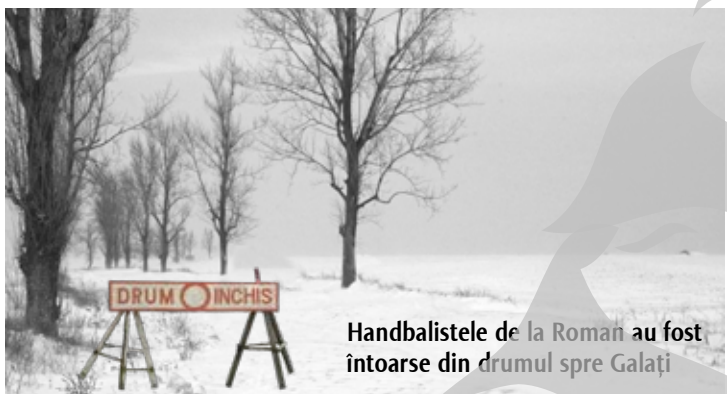
Handbalistele de la Roman au fost întoarse din drumul spre Galați

► Voleibaliștii de la CSU Galați au fost forțați să stea trei zile în București ► Voleibalistele aceluiași club, la fel ca hocheiștii de la Dunărea, n-au mai plecat spre Capitală