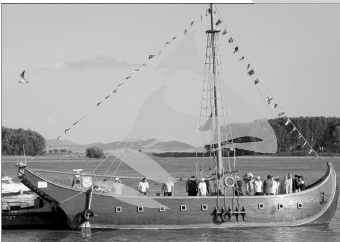
Un colac de salvare pentru Pânzarul Moldovenesc!