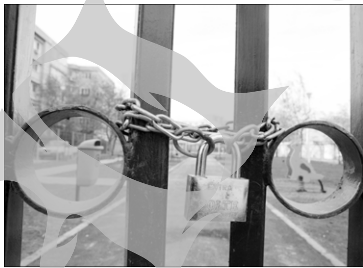
Interzis la joacă

De poveste a fost și parcul special amenajat pentru câini, pe faleză. La data anunțării lui în presă nu era decât un țarc cu gardul de 30-40 de centimetri care ar putea fi sărit cu ușurință de câini de talie medie și mare, împrejmuit doar pe trei laturi, fără intrare, fără coșuri de gunoi și cu căi de acces extrem de dificile. Haaui!