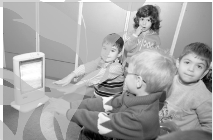
Radiatorul ține de cald, Apaterm de frig

Doă săptămâni întregiu au tremurat gălățenii locatari ai celor 80.000 de apartamente încălzite de Apaterm, dar și copiii din școli și grădinițe, în vreme ce autoritățile o țineau „langa” în „comitete