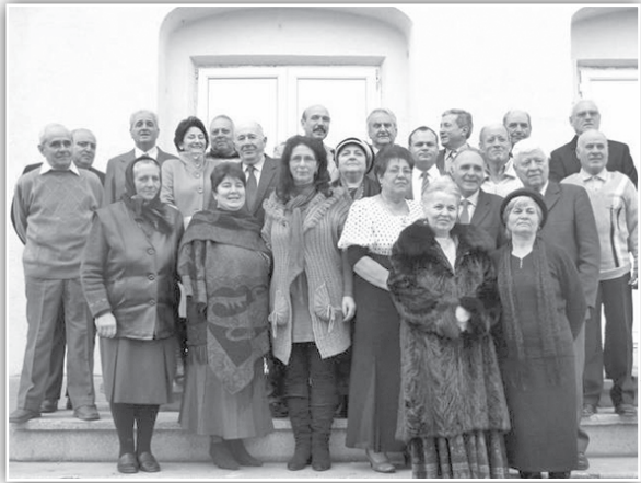
Promoția 1966 a Școlii din Șivîța