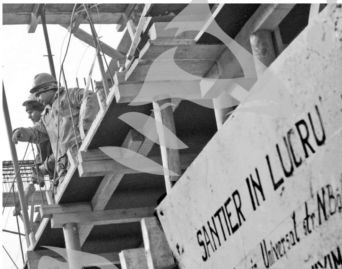
Mediul de afaceri, în "reconstrucție"

Dincolo de procente, situația forței de muncă din județul Galați apare ca fiind și mai dramatică dacă ținem cont de numărul efectiv de persoane care, dintr-un motiv sau altul, nu au un loc de muncă. La mijlocul lunii decembrie în evidențele AJOFM Galați se aflau 21.292 de șomeri, dintre care 8.068 erau indemnizați, dar grosul de 13.224 de persoane erau neindemnizate. Dacă la asta mai ținem cont și de faptul că, la nivelul județului Galați, se mai înregistrează și 19.186 de persoane beneficiare ale veniturii minim garantat în con-