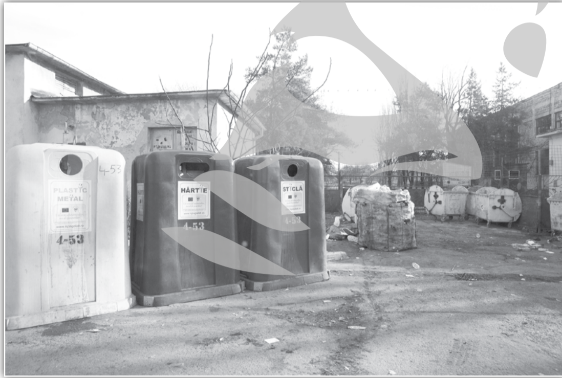
Colectarea selectivă europeană este făcută la Galați în stil pur românesc