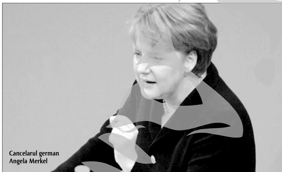
Cancelarul german Angela Merkel

Comisarul european pentru Afaceri Economice Olli Rehn și-a exprimat „regretul față de decizia aberantă” a agenției S&P. „După ce am verificat că momentul nu a fost ales la întâmplare, regret decizia aberantă adoptată de Standard and Poor's cu privire la ratingul mai multor țări din zona euro, în momentul în care acestea acționează hotărât pe toate fron-