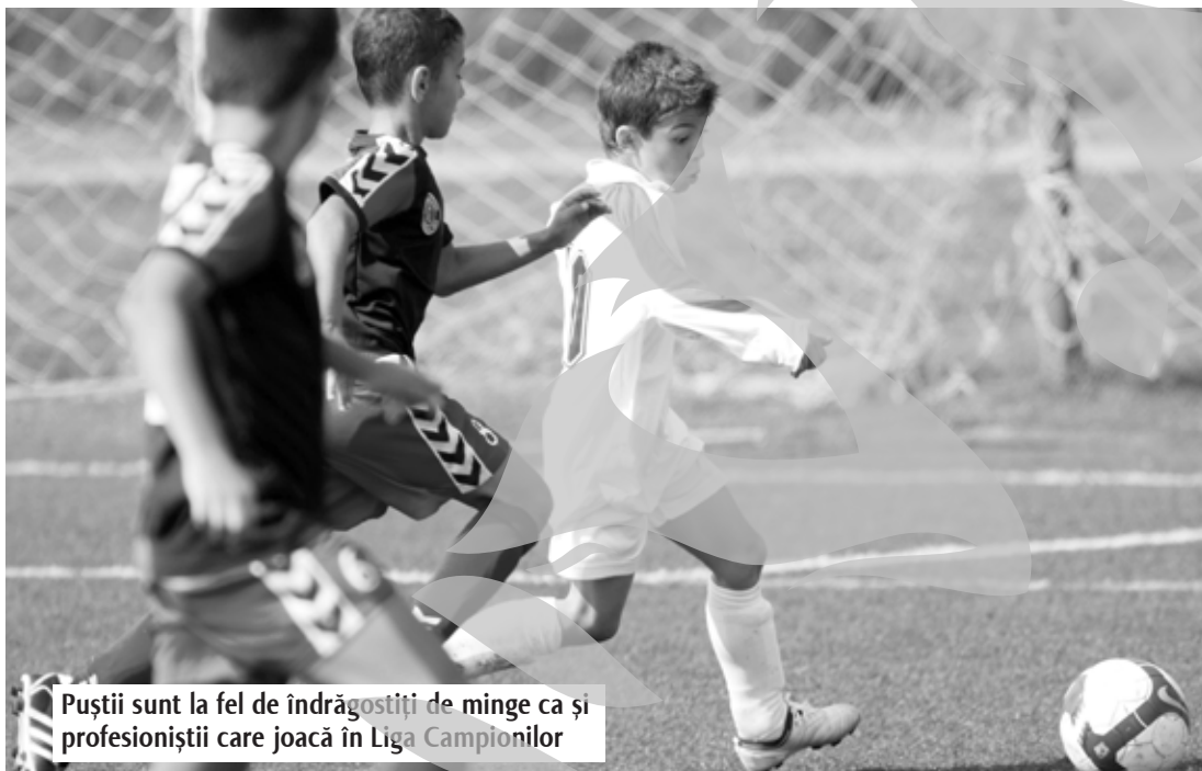
Puștii sunt la fel de îndrăgostiți de minge ca și profesioniștii care joacă în Liga Campionilor