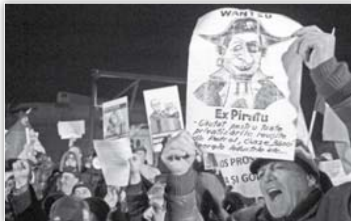
Fostul pirat, în prezent președinte de stat, Traian Băsescu, căutat de populație