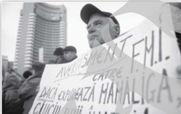
FMI-ul este avertizat despre „explozia mămăligii”