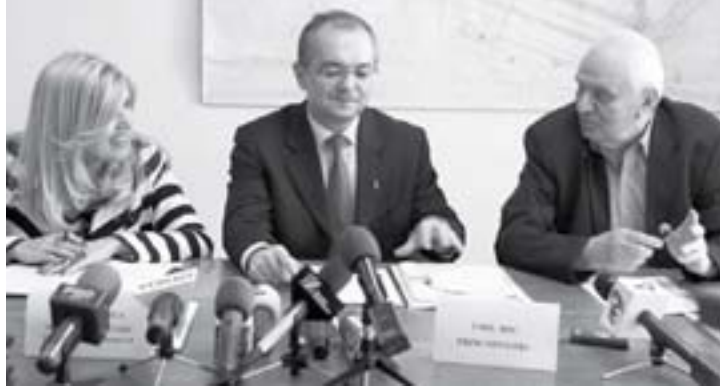
Premierul și ministrul Dezvoltării la masă cu primarul