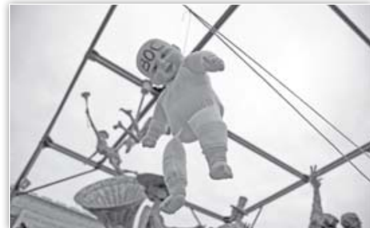
Dacă am fi un popor de extremiști, soarta lui Emil Boc ar fi una cruntă...