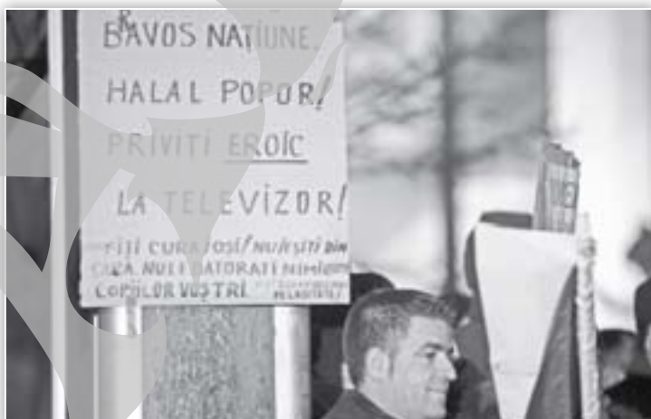
Nu au fost uitați nici cei care privesc revoltele din fața televizorului