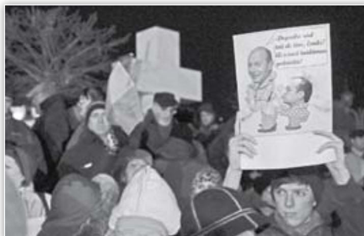
Glumele pe seama înălțimii premierului Emil Boc sunt din nou la modă