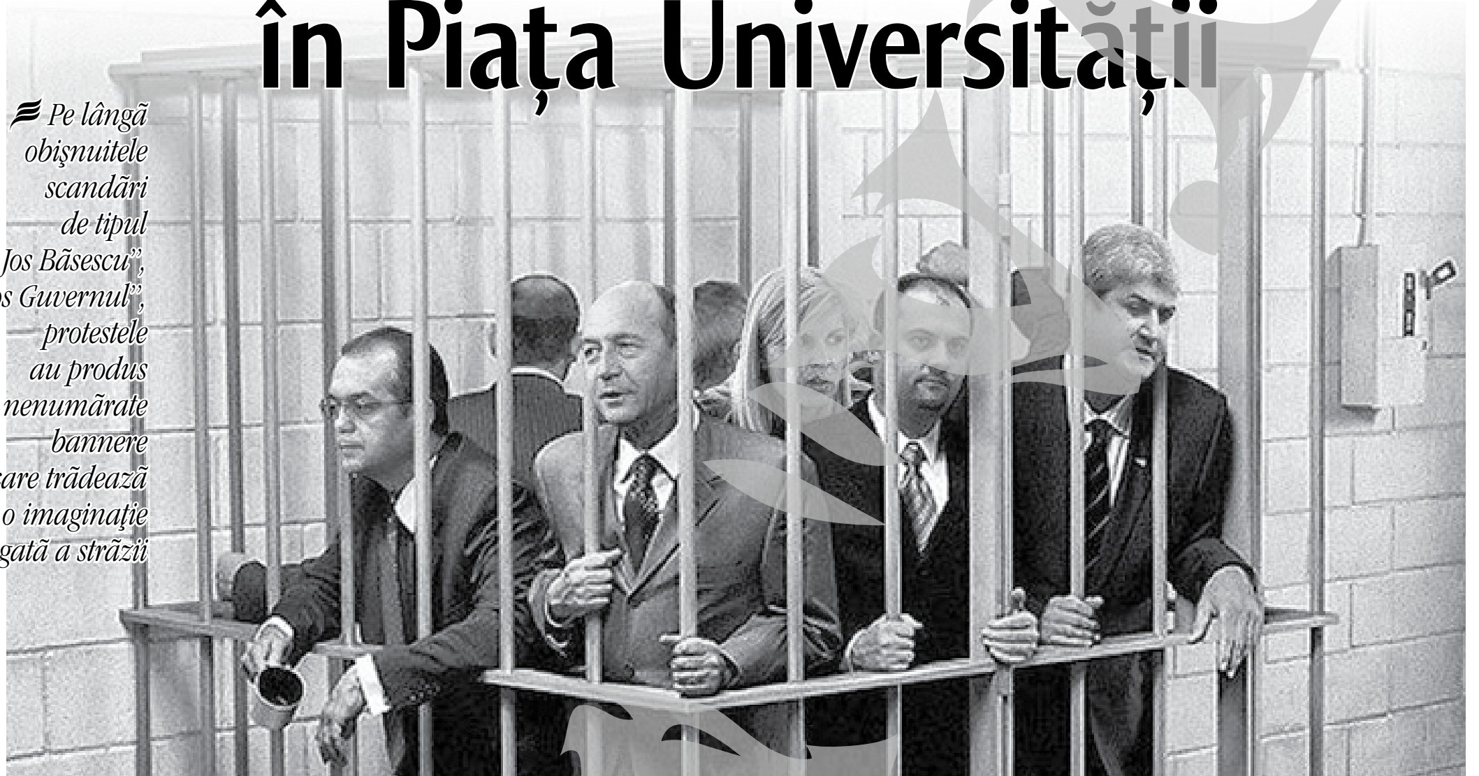
Într-una din cele mai des întâlnite imagini trucate în mediul on-line, îi regăsim pe Traian Băsescu, Emil Boc sau Elena Udrea după gratii

Pe lângă obișnuitele scandări de tipul „Jos Băsescu”, „Jos Guvernul”, protestele au produs și nenumărate bannere care trădează o imaginație bogată a străzii