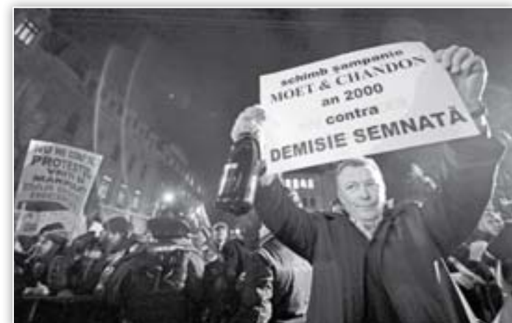
Cât o șampanie, atât mai valorează președintele și Guvernul în ochii protestatarilor

pagină realizată de Marius Chiriliuc chiriliuc@viata-libera.ro