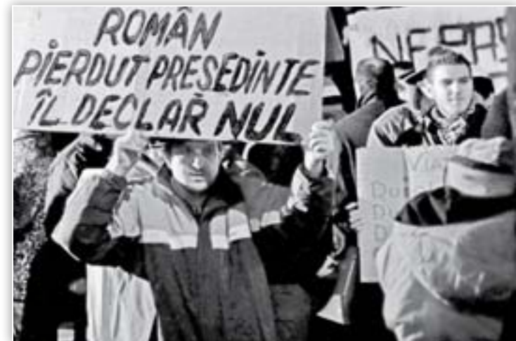
Românii îl declară pierdut pe Traian Băsescu