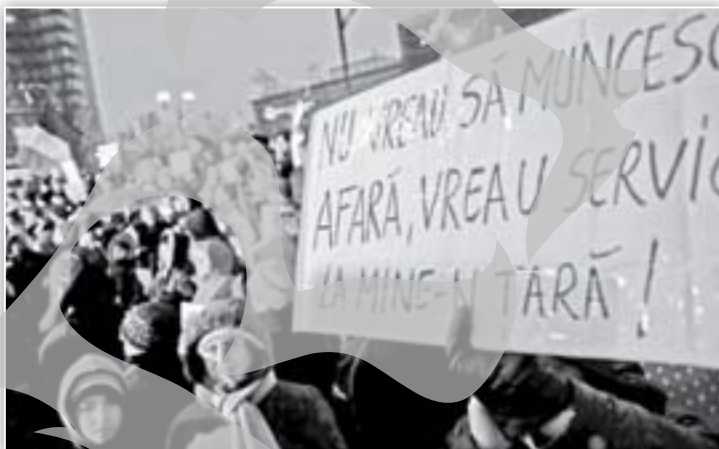
Unul dintre sutele de mii de români nemulțumiți că sunt nevoiți să plece în străinătate pentru un job bine plătit