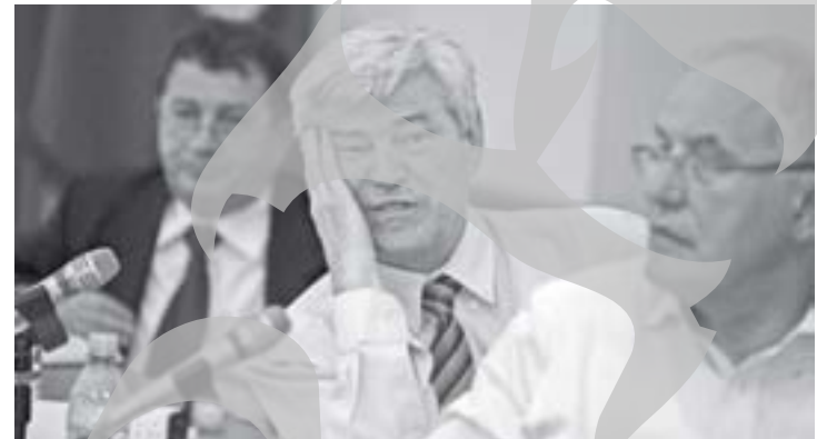
Ministrii Mediului și Agriculturii, Laszlo Borbely, respectiv, Valeriu Tabără, au participat la seminarul