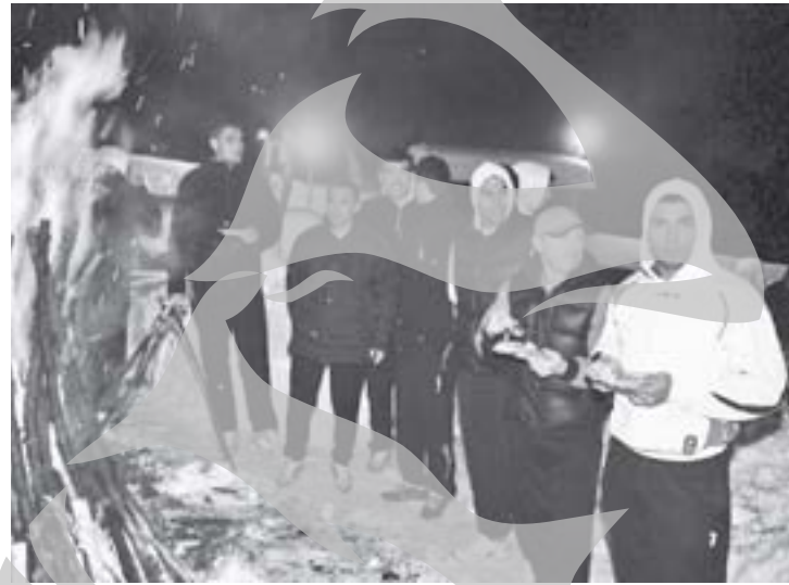
Campionii României și-au încălzit privirea în jurul focului de tabără

► Roș-alb-albaștrii s-au relaxat preț de trei ore la un restaurant rustic din stațiunea brașoveană la sfârșitul celor opt zile de alergări prin zăpadă, la 1.000 de metri altitudine