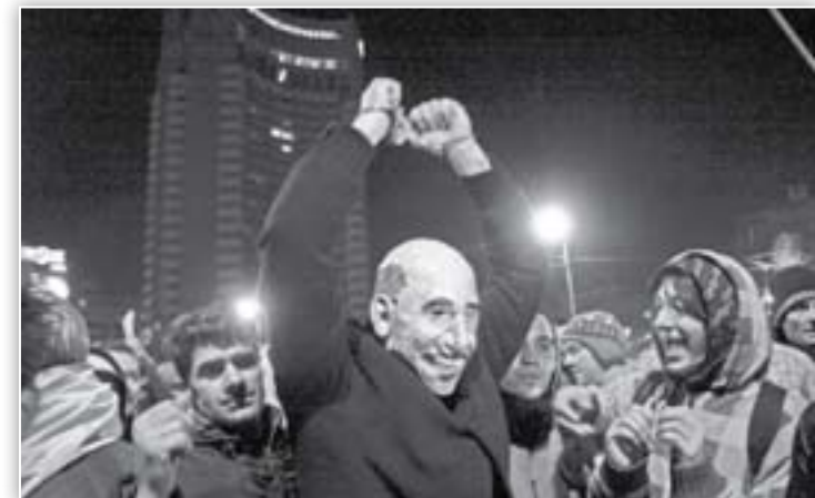
Președintele Traian Băsescu, în mijlocul protestatarilor, cu cătușele la mâini