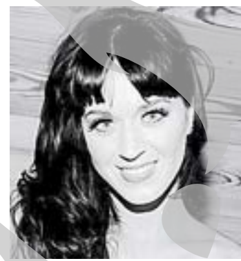
paniei The Sims Studio pentru a crea împreună accesorii, articolele vestimentare și obiectele de mobilier din noul joc.

Cântăreața americană Katy Perry va fi „transformată” într-un personaj care va apărea într-un nou joc video, intitulat „The Sims 3 Showtime”, ce va fi lansat în luna martie. Astfel, fanii artei americane vor putea să devină personajul Katy în acest joc de strategie, care simulează evenimentele din viața reală a cântăreței, și să obțină o serie de bonușuri, al căror design este inspirat din cariera acesteia. Katy Perry va fi, totodată, imaginea noului joc și va participa la numeroase evenimente incluse în campania de promovare a acestuia. Artista va colabora cu specialiștii com-