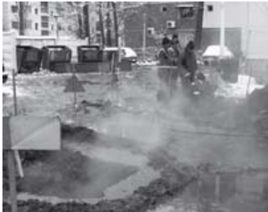
Pierderi uriașe în rețelele Apaterm