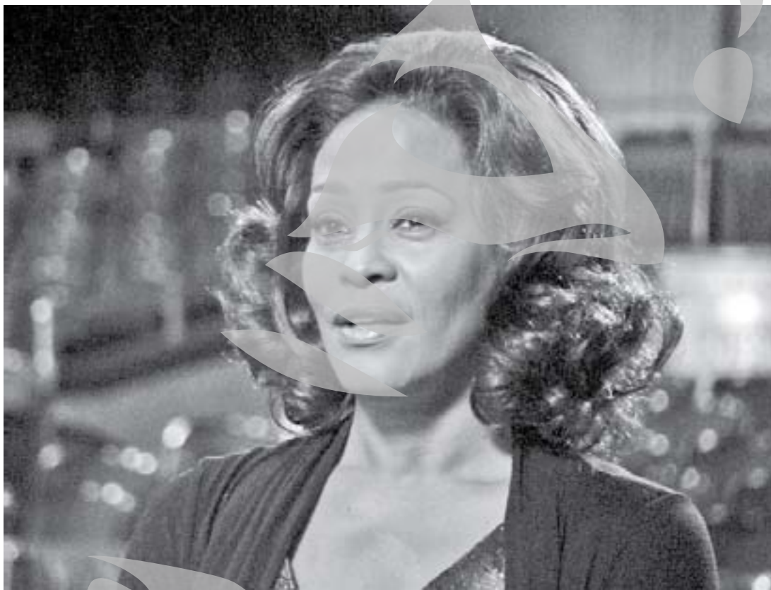
În anii 1990, Whitney Houston a fost numită "Regina muzicii pop" sau, pur și simplu, "Vocea"

Whitney Houston este singurul artist din lume care a lan-