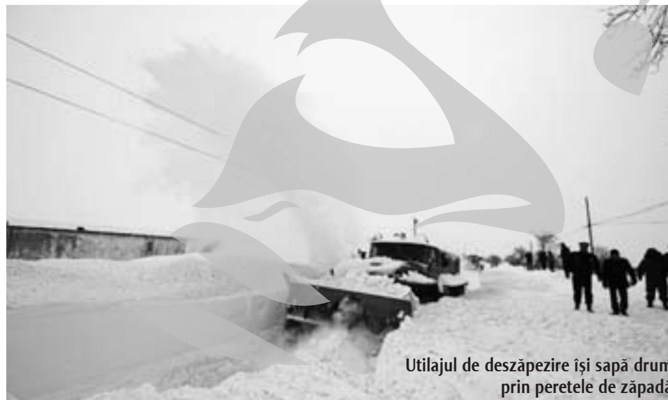
Utilajul de dezapezire își sapă drum prin peretele de zăpadă