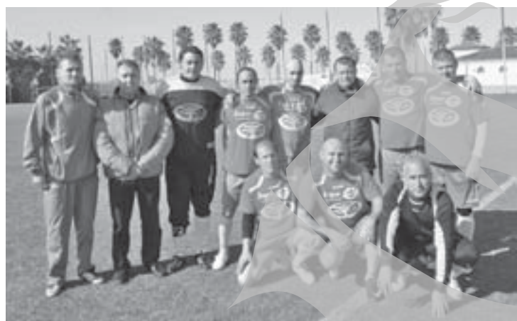
Jucătorii naționalei în șapte a României, alături de fostul mare internațional Dorinel Munteanu

Formația lui Dorinel Munteanu a fost ieri încurajată din tribună de câțiva compatrioți stabiliți în Peninsula Iberică și care au format naționala în șapte a României „Nu suntem căpșunari, urâm acest termen”, au ținut să precizeze jucătorii de minifotbal, doi dintre ei fiind gălățeni