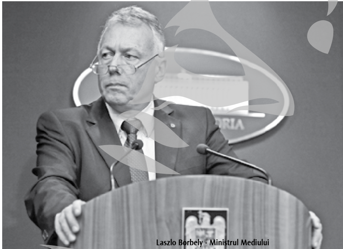
Laszlo Borbely - Ministrul Mediului

Până la sfârșitul lunii februarie nu există o probabilitate semnificativă pentru producerea unor viituri cu risc major de inundații, a anunțat ieri Ministerul Mediului și Pădurilor (MMP), ai cărui specialiști au analizat probabilitatea apari-