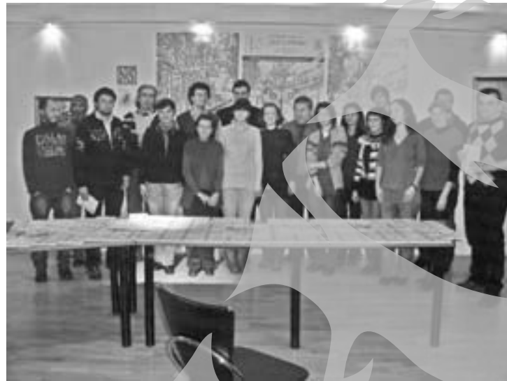
Desant literar 2012 - cei 23, alături de directorul Centrului și de inițiatorul proiectului, abia încap în cadrul!

„Cuvinte noi pe Domnească”, o nouă antologie de la Centrul Cultural „Dunărea de Jos”, una a noului val gălățean: poeți, ceva prozatori, chiar și un dramaturg, majoritatea tineri și foarte tineri, publicați în reviste, preluați. Nu, nu fac parte din vreo uniune de creație a scriitorilor profesioniști, au însă în spate mai multe cenecluri și, ceea ce contează, două