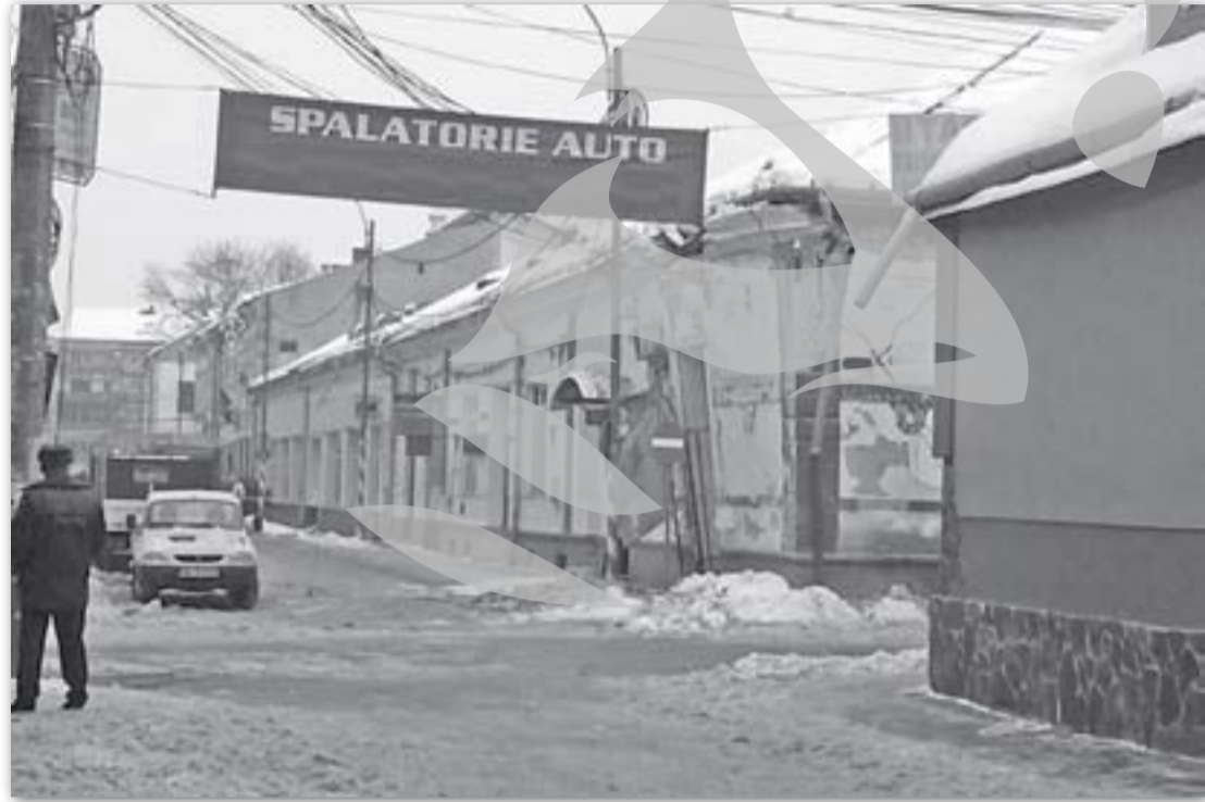
Imobilul afectat de exploziile din Sighetu Marmăției

În timp ce victimele ajungeau la spitalul din București, o altă explozie avea loc, în aceeași clădire, răbind alte două persoane, fiind vorba despre trei polițiști (unul dintre aceștia aflându-se în stare