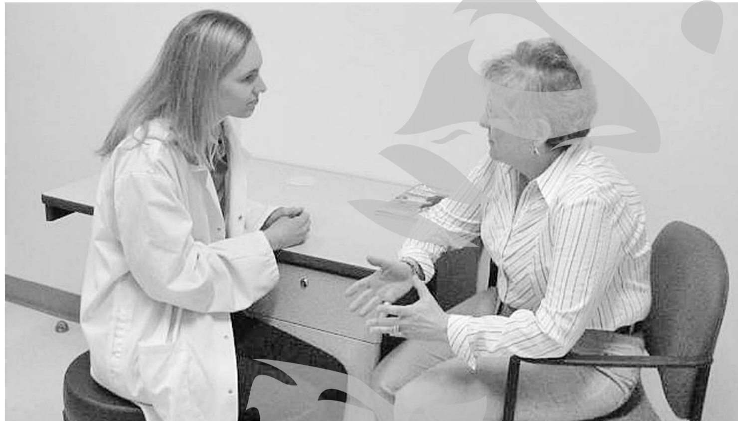
Principala problemă: lipsa locațiilor pentru cabinete