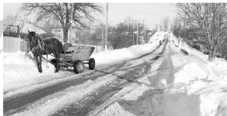
Când zăpada acoperă șanțurile de scurgere din fața caselor, sătenii se tem pe bună dreptate de inundații

Pentru a doua oară în decurs de câteva zile, un cititor al cotidianului „Viața liberă” din satul Hanu Conachi ne-a sesizat, telefonic, îngrijorat: „Cei de la depozitul de înghețăminte Linzer au depozitat toată zăpada strânsă de pe terenul lor în șanțurile satului și, dacă tot așa de cald va fi, zăpada se va topi foarte repede și ar putea să intre apa în curțile oamenilor”.