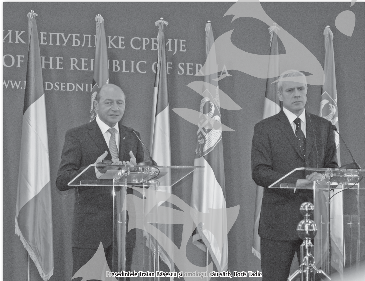
Președintele Traian Băsescu și omologul său sârb, Boris Tadić

În Voivodina, românii beneficiază de învățământ public, emisiuni de televiziune și posturi de radio în limba română, iar în 2001 a fost înființată și o episcopie ortodoxă română, care a fost recunoscută de Ministerul Cultelor din Serbia în aprilie 2009 și care are sub jurisdicția sa doar parohiile românești din Voivodina. Numiți "vlahi", românii din Timoc au fost privați de învățământ sau activități culturale și religioase în limba maternă.