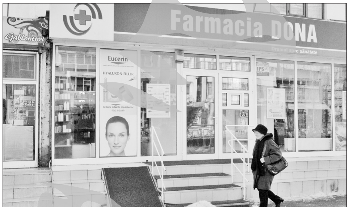
Farmacia Dona de pe Siderurgiștilor este unul dintre obiectivele verificate

Au fost luate în considerare și date de la Casa de Asigurări de Sănătate, care, normal, vor fi completate cu cele obținute din