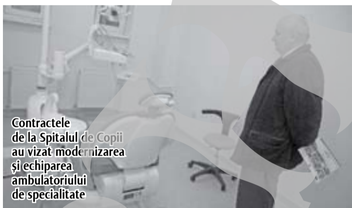
Contractele de la Spitalul de Copii au vizat modernizarea și echiparea ambulatoriului de specialitate

Am ajuns cu analiza licitațiilor atribuite de Primăria municipiului Galați la anul 2010, studiul nostru vizând doar contractele prezentate pe pagina internă a administrației locale.