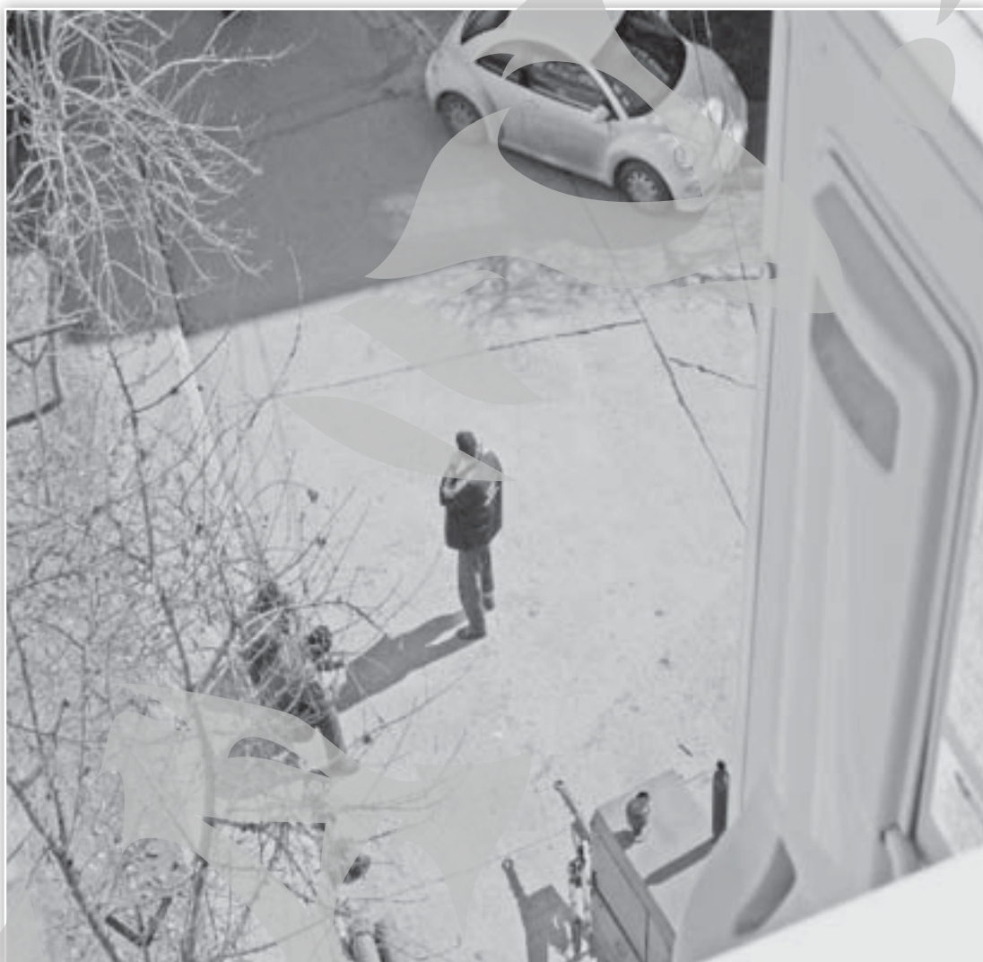
Apă Canal a anunțat sistarea furnizării de apă rece pentru lucrări, dar, după cum se poate vedea din fotografia trimisă de cititorul nostru, muncitorii mai mult se fac că muncesc

„Deși eu sunt bun-platnic, nu am nici apă caldă, nici căldură și,