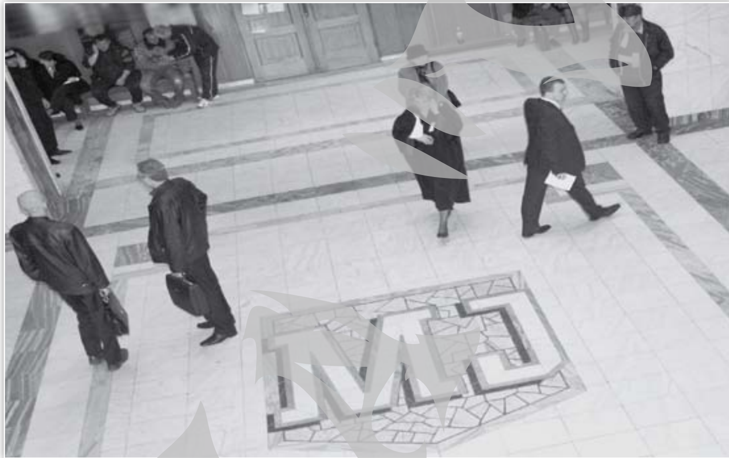
Dosarul a schimbat atâția judecători încât fapta s-a prescrist