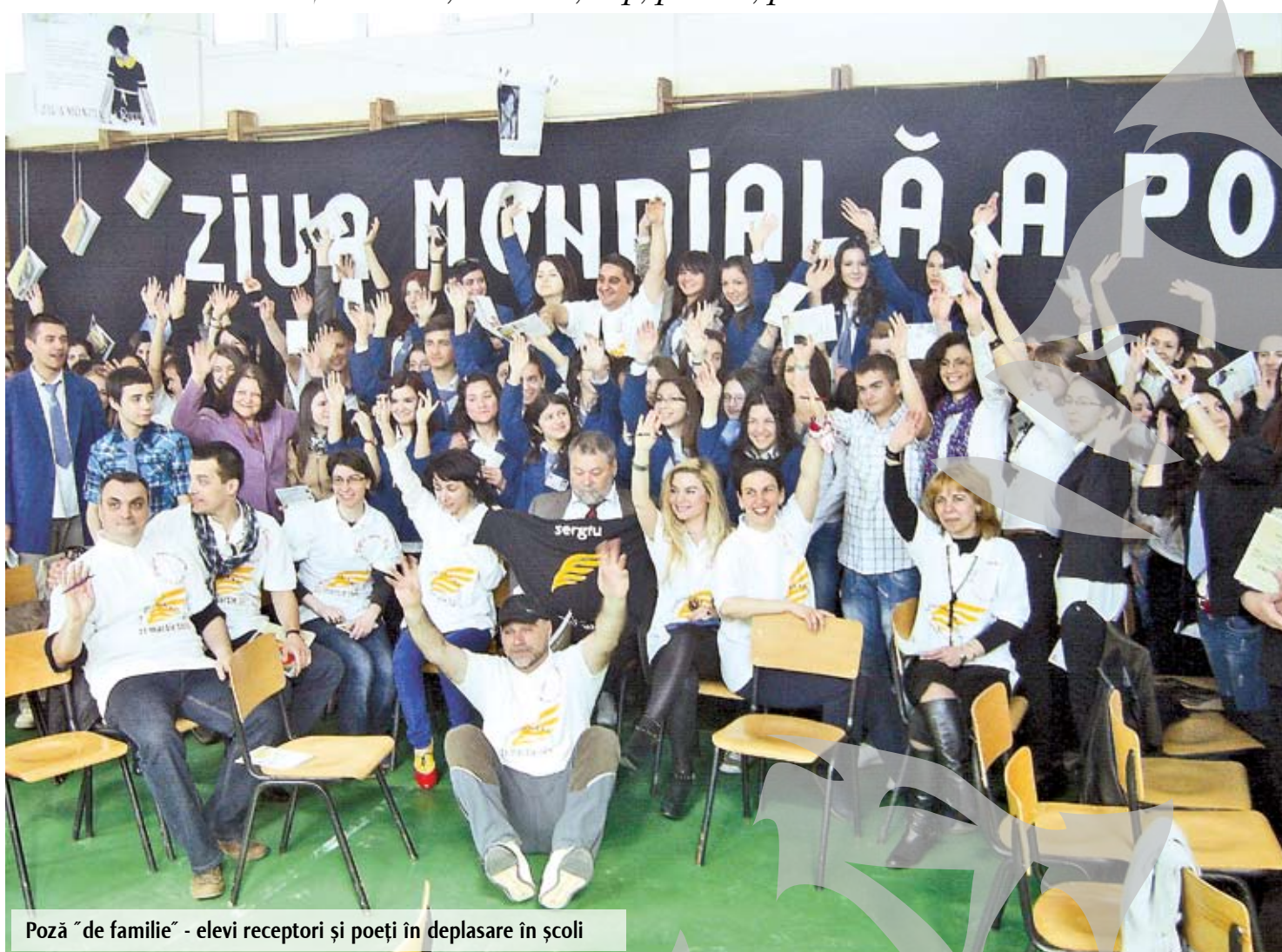
Poză "de familie" - elevi receptori și poeți în deplasare în școli