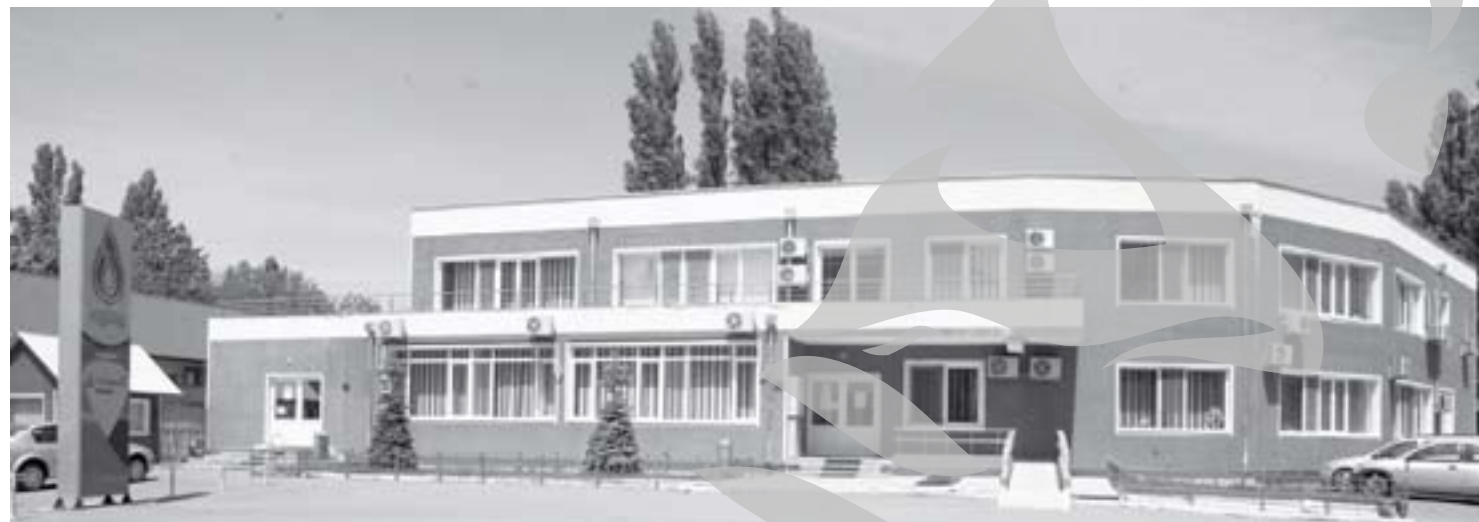
istoria se repetă

Pe masa aleșilor locali a ajuns, la ședința pe comisii, un proiect de hotărâre care propune majorarea prețului mediu de producere, transport, distribuție și furnizare a energiei termice, dar și a subvenției acordate de la bugetul local pentru căldură. Numai că propunerea nu vizează doar viitorul, așa cum ar fi normal, ci și trecutul, adică se propune o halucinantă majorare retroactivă. Proiectul nu afectează însă în mod direct factura la încălzire plătită de gălățeni, ci doar subvenția plătită de la bugetul local (ceci tot din banii noștri). Pentru gălățenii dependenți de Apaterm, prețul de facturare a energiei termice rămâne tot de 247,73 lei/Gcal, inclusiv TVA, cât s-a stabilit în noiembrie anul trecut.