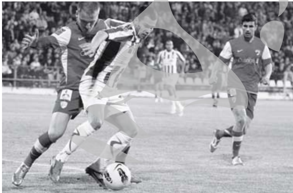
Imagine sponsorizată de VEGA