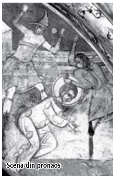
Scenă din pronaos