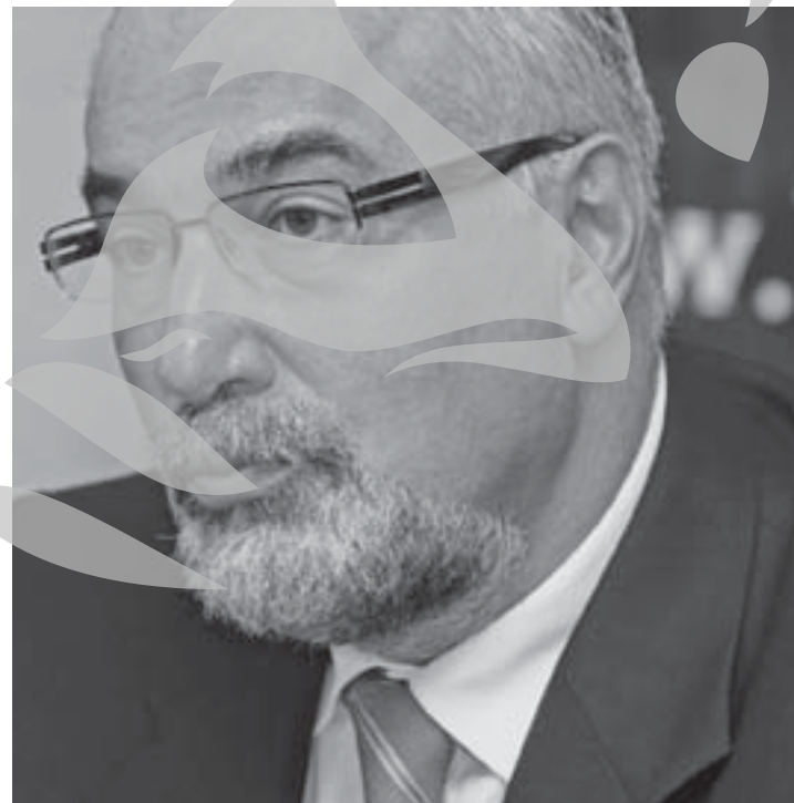
Varujan Vosganian - vicepreședintele PNL

Varujan Vosganian a declarat că USL nu va participa la dezbaterea parlamentară a Legii energiei, arătând că este o "făcătura" prin care Guvernul "îi face cadou" președintelui Traian Băsescu reglementarea domeniului. Potrivit proiectului legii, conducerea viitoarei agenții naționale de reglementare în domeniul energetic, adică președintele, vicepreședintele și cei cinci membri ai consiliului de reglementare vor fi numiți de către președintele României, iar Parlamentul îi va putea numai audia în comisiile de specialitate - "un rol de-a dreptul batjocoritor", a declarat Vosganian. El a arătat că persoanele numite pe perioade de 5-7 ani în conducerea viitoarei agenții de către președinte nu vor putea fi schimbate decât în situații de incompatibilitate sau dacă încalcă legea. "Acest proiect de lege transformă sectorul energetic într-un fel de AGA în care președintele României numește membrii. Devine un fel de companie prezidențială în care președintele României stabilește felul în care este reglementat domeniul, împotriva tuturor principilor europene", a spus oficialul. Vicepreședintele PNL a arătat că se încalcă astfel principiul inde-