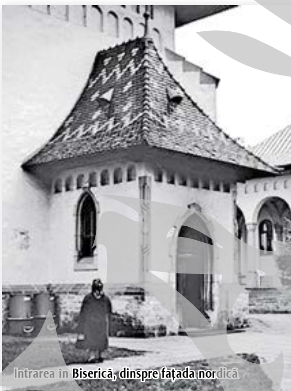
Intrarea în Biserică, dinspre fațada nordică