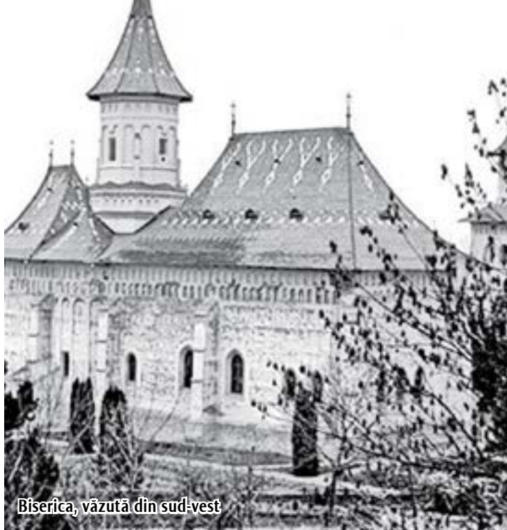
Biserica, văzută din sud-vest