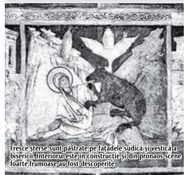
Fresce șterse sunt păstrate pe fațadele sudică și vestică a bisericii. Interiorul este în construcție și din pronaos scene foarte frumoase au fost descoperite

La sfârșitul secolului al XV-lea, biserica anterioară Metropolitanatului trebuie să fi fost deja prea mică pentru nevoile sale. De aceea, în 1514, Bogdan III a început construirea unui nou locaș, actuala biserică „Sf. Gheorghe”. Prințul Ștefăniță a terminat construcția cum a urcat la tron. El a dorit să arate că a continuat interesul bunicului în a construi biserici, dar în același timp și-a întărit autoritatea care se diminuase semnificativ în timpul copilăriei sale.