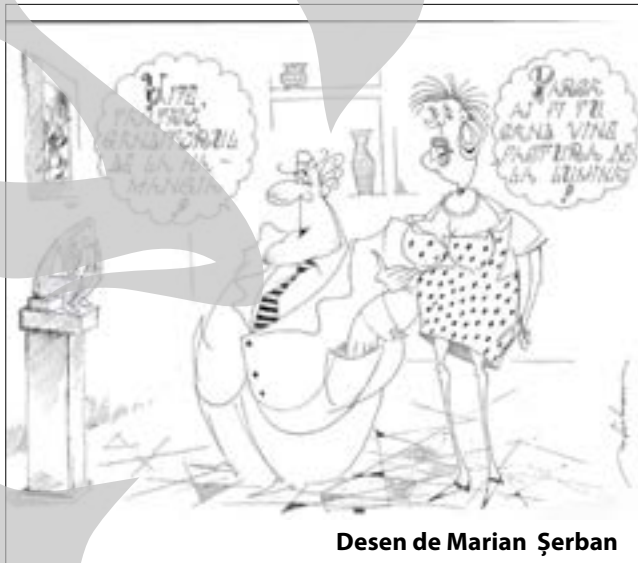
Desen de Marian Șerban