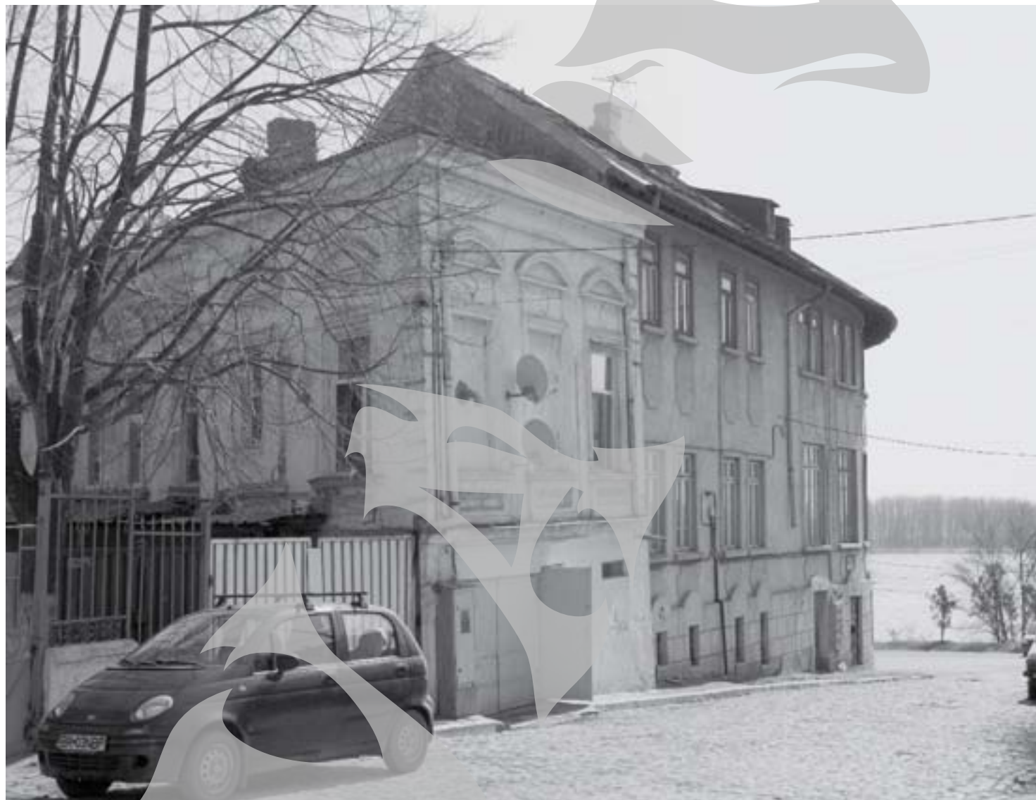
Din cauză că garajul e amplasat pe țevile de apă, nu se poate interveni pentru reparații

Niță Podaru, directorul de producție al firmei amintite, susține că nu intră în responsabilitatea acesteia reparațiile de