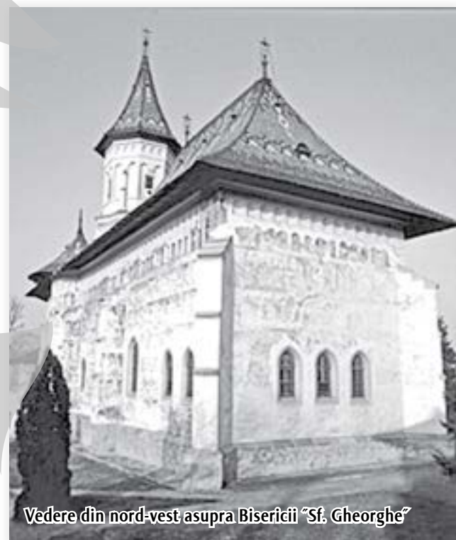
Vedere din nord-vest asupra Bisericii "Sf. Gheorghe"