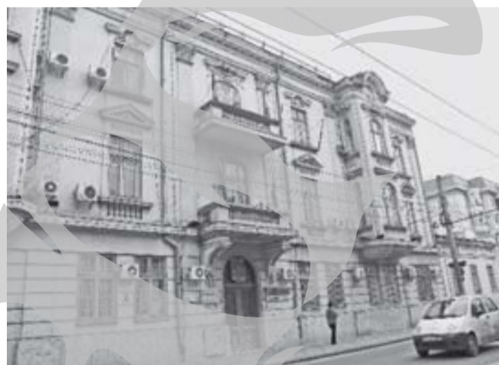
Asociațiile de locatari sunt nemulțumite de răspunsurile primite de la Primărie

Conducerea Asociației de Locatari nr. 217 ne-a trimis pe adresa redacției o scrisoare deschisă adresată în primul rând celor care ne conduc. Vom reda scrisoarea primită în două părți, ea fiind foarte lungă, pentru că problemele care sunt semnalate în ea merită supuse atenției gălățenilor. „Ne-am adresat în scris, în conformitate cu art. 51, alin. 2 din Constituția României ca și reprezentanți legali pentru aproximativ 600 de cetățeni ai acestui municipiu, autorităților locale și centrale, referitor la modificarea din mers cu tot felul de hotărâri guvernamentale și locale a legislației referitoare la funcționarea asociațiilor de proprietari, îngrădind drepturile cetățenilor acestui municipiu, ca de altfel în întreaga țară, aspect reglementat de art. 52, alin. 1 din Constituția României. Suntem convinși că mare parte din legislația emisă de ANRSC cu girul Guvernului României prin hotărâri de Guvern referitoare la sistemele de contorizare