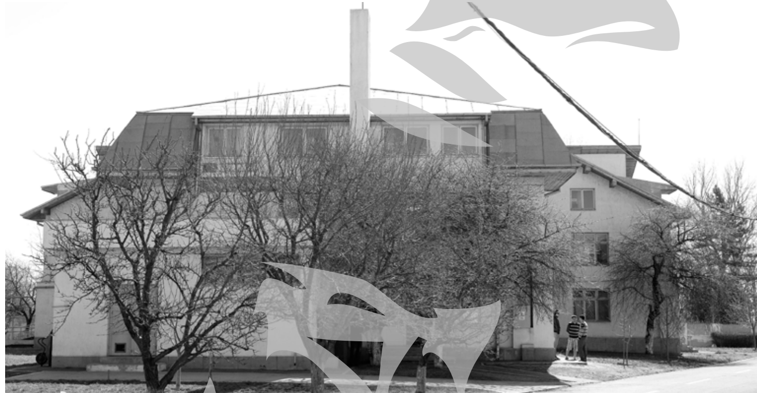
Centrul de Cazare pentru Refugiați de la Galați

„A crescut cu 300 la sută numărul refugiaților care au trecut prin centrul nostru în ultimii trei ani, iar tendința este, în continuare, ascendentă. Dacă până nu demult filiera preferată de străini pentru a ajunge în România era de regulă Turcia - Grecia - Serbia - România, pe la Timișoara, acum au început să vină pe frontiera de est, mai exact pe la Oancea. Ajung