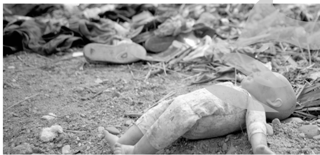
Terenul viran de 5.000 de metri nu este curățat de proprietar

Locatarii blocurilor situate în apropierea Cimitirului Eternitatea se plâng din cauza grămezilor de moloz și gunoaielor din fostul poligon auto pe care sunt nevoiți să le vadă zilnic. Oamenii sunt nemulțumiți de faptul că terenul viran de peste 5.000 de metri pătrați se transformă tot mai mult, pe an ce trece, într-o groapă de gunoi.