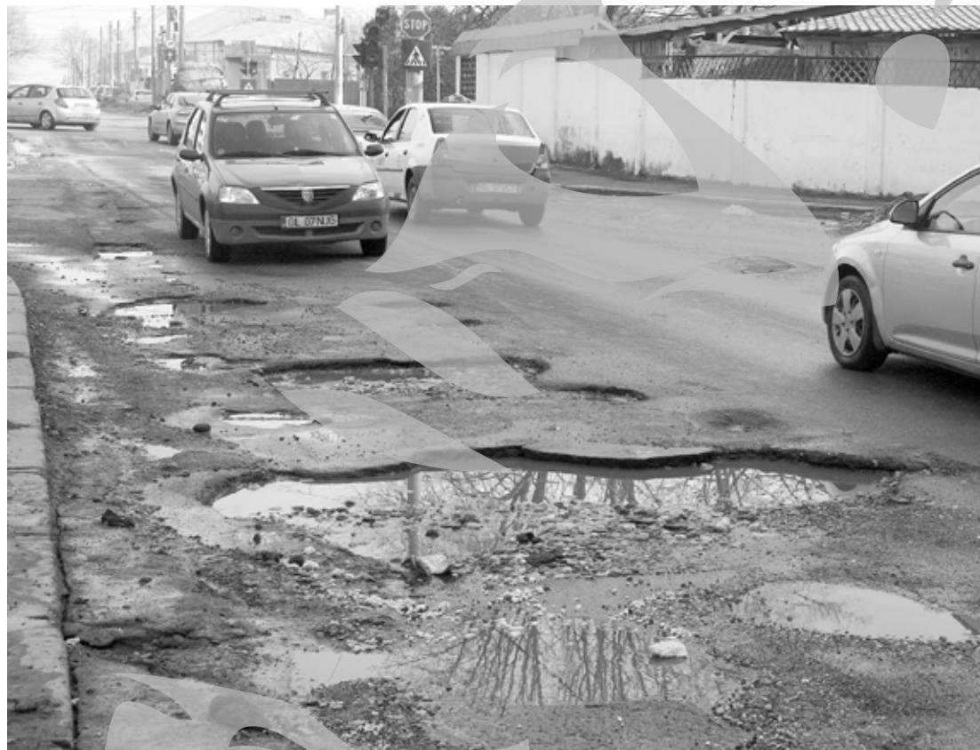
Vom avea vreodată drumuri bune?

Mai există o practică. Se face lucru de slabă calitate, ca lucrarea să se repete și la anul, pentru noi peșcheșuri. Am aflat cu precizie că doi cercetători români au meșterit un bitum care, dacă este fabricat potrivit brevetului, respectând „ad literam” toate prescripțiile acestuia, oferă un asfalt care rezistă zece ani. E drept, prețul este ceva mai mare. Dar durata sa de viață, fără cărpeli anuale, ar trebui să-i facă pe constructori