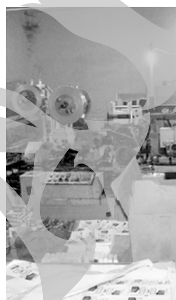
„Fabrica” de țigări de la Tirighina