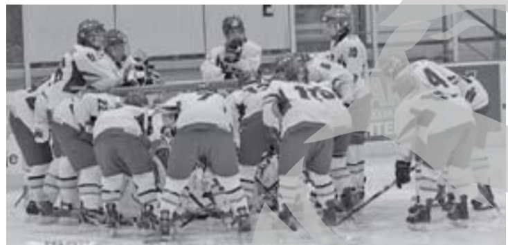
Echipa României, înaintea meciului cu Olanda

Echipa națională a României s-a clasat pe locul al doilea la Campionatul Mondial de hochei pe gheață pentru juniori Under 18 (Divizia a II-a, Grupa A), desfășurat în Olanda, la Herenveen. Juniorii români au câștigat patru din cele cinci partide, singura înfrângere fiind suferită la limita în fața marii surprize a turneului,