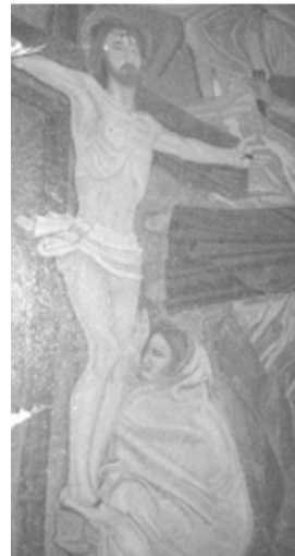
Răstignirea Mântuitorului - Ierusalim