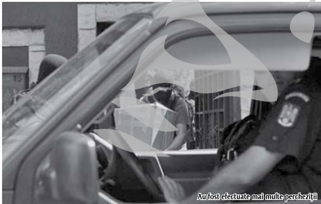
Au fost efectuate mai multe percheziții