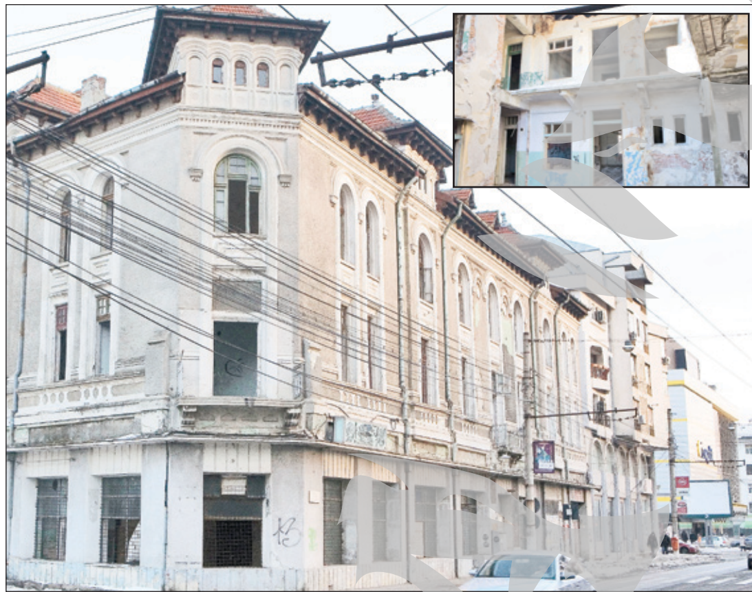
Cu puțin timp în urmă, clădirea din Domnească 24 era neîngădită și nepăzită

Așa cum am mai scris, Direcția Județeană pentru Cultură și