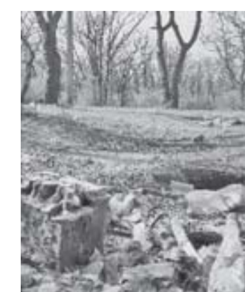
Anul trecut, PET-urile erau stăpâne pe pajistile din Pădurea Gârboavele

„Dacă oamenii vor da dovadă de bun-simț și nu vor arunca gunoaiele aiurea, probabil că pădurea va arăta așa cum trebuie. În plus, vor ușura mult munca angajaților noștri”, a ținut să pre-