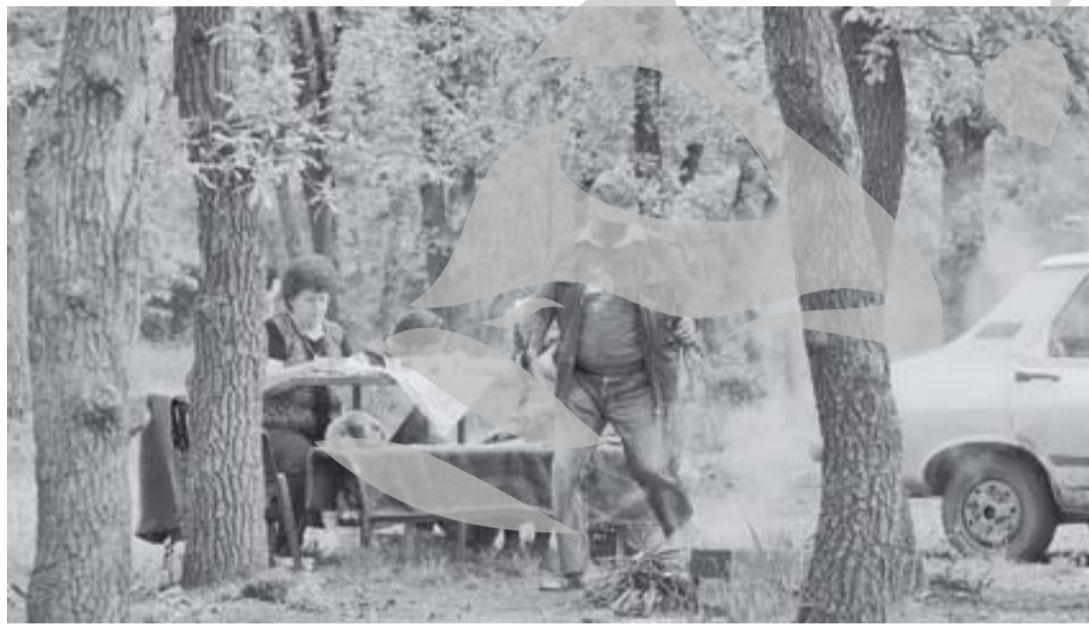
Locuri pentru grătare sunt, Slavă, Domnului, numai să avem ce pune pe ele!

Și gazele de la Zătun s-au pregătīt pentru vizita amatorilor de grătare. Pentru doar 10 lei de ma-