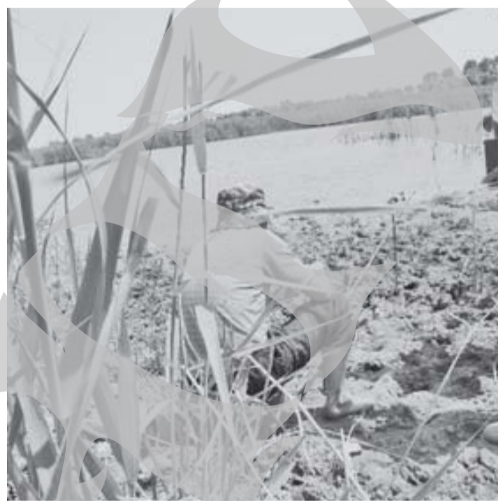
Are balta pește pentru toată lumea!