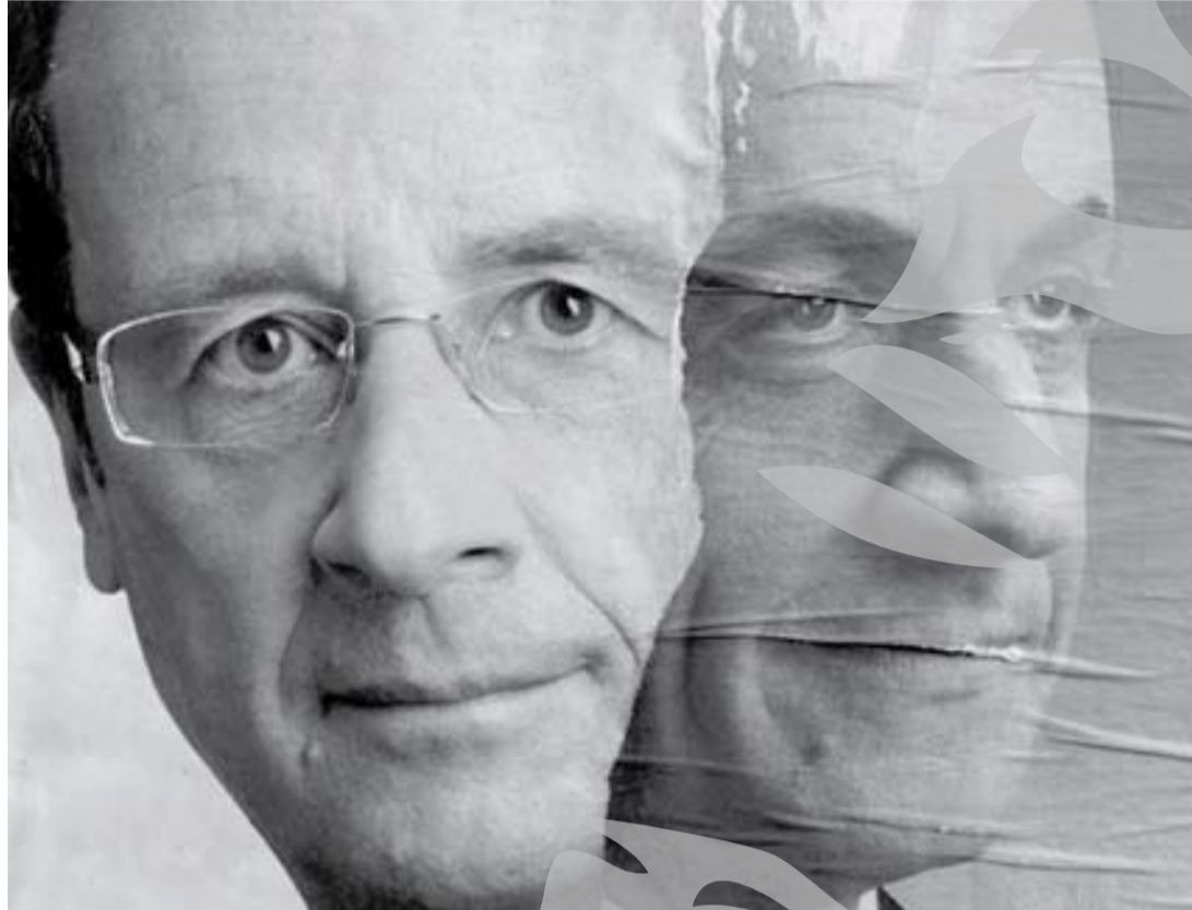
Francois Hollande sau Nicolas Sarkozy?

Considerat de mai multe luni câștigător net în turul al doilea,