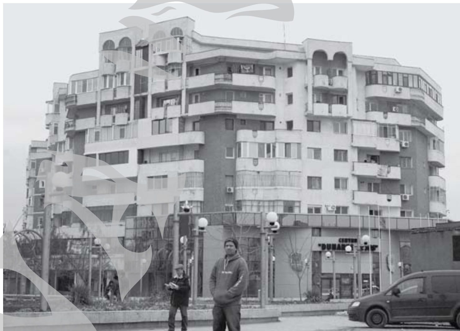
Blocul V3 e plin de apartamente de intervenție pentru „specialiști”