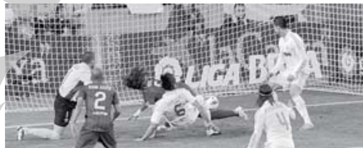
Faza primului gol reușit de Real Madrid în partida de sâmbătă

Mult așteptatul duel dintre Barcelona și Real Madrid a fost tranșat de oaspeții după o partidă la finalul căreia antrenorul catalanilor și-a felicitat adversarii, atât pentru victoria din meciul direct, cât și pentru parcursul din întregul sezon. Partida a fost echilibrată, dar madrilenii au reușit să puncteze primii prin Khedira (13'), în urma unui corner, după o ieșire eronată a portarului Victor Valdes. Catalanii au încercat să mute centrul de greutate în jumătatea adversă, dar fără a pune în pericol poarta lui Casillas. Până la pauză, doar Xavi (27') a avut golul egalizator în vârful gheții, atunci când a scăpat singur spre poartă, după o pasă măiestră a lui