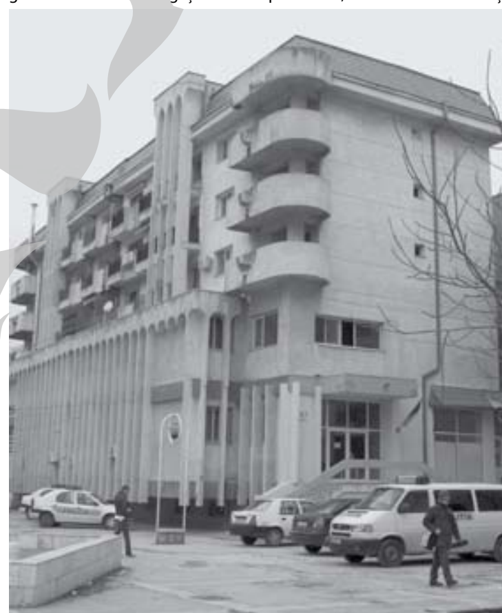
Apartamentele din blocul L pot fi considerate „de lux” în Galați