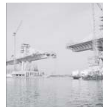
Podul Calafat-Vidin, aflat în construcție

Conform ultimelor strategii dezvoltate pentru zona de sud a Moldovei, podul peste Dunăre care să lege județul Tulcea de restul României ar putea fi construit