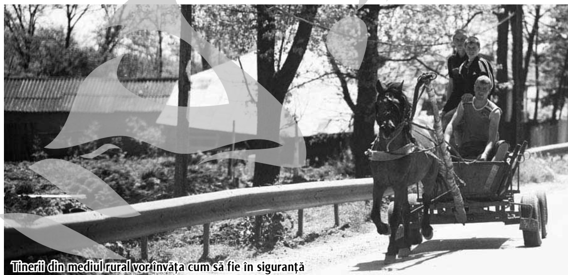
Tinerii din mediul rural vor învăța cum să fie în siguranță

Campania costă 3.500 de lei și este finanțată de DJTS Galați.