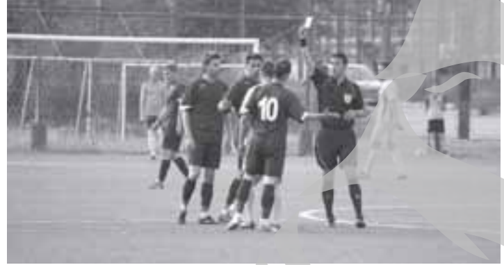
Cei de la Politehnica au avut probleme cu arbitrajul în meciul de la Suceava, State și Petică fiind eliminați

În sfârșit, a răsarit soarele și pe strada echipelor noastre! În runda a 26-a ambele formații gălățene din al treilea eșalon au reușit rezultate pozitive: Politehnica în deplasare, Oțelul II pe teren propriu. Prin egalul „smuls” la Suceava, „studentii” și-au mărit șansele de a-și menține locul în eșalonul al treilea, în timp ce „oțelarii” tineri nu au probleme la acest capitol.