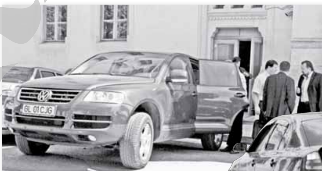
Mașina de teren a CJ cu care se deplasează președintele instituției

Din cele 25 de mașini de serviciu ale DJPC, nouă sunt