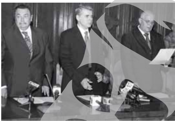
Ministrul Administrației, Victor Paul Dobre, i-a numit pe noii reprezentanți ai Guvernului în teritoriu