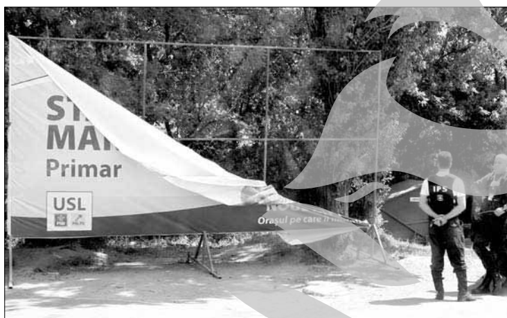
Vântul a desfăcut afișul USL