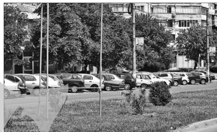
Marius Necula luat de vânt

În comuna Umbrărești Tentativă de sinucidere