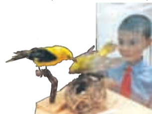
Expoziția rămâne deschisă până în data de 28 octombrie

Expoziția temporară „Artizanii naturii”, deschisă de la sfârșitul săptămânii trecute, la Complexul Muzeal de Științe ale Naturii, este un prilej de a afla că, în natură, există insecte, păsări și animale care sunt adevărați zidari, mineri, țesători, modelatori de ceață, făuritori ai paradisurilor subacvatice sau torcători. La eveniment, cele mai multe priviri le-a atras un exemplar viu de tarantulă, de 12 centimetri,