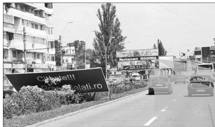
Vântul a pedepsit panoul neautorizat