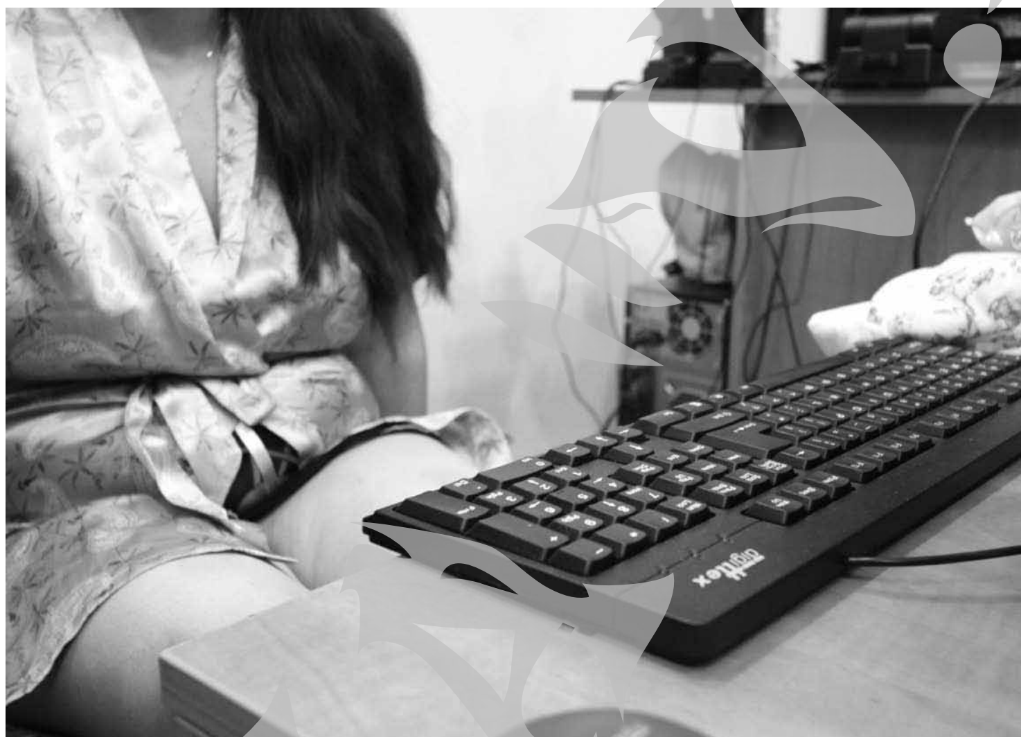
Frânturi din lumea secretă și ciudată a videochatului