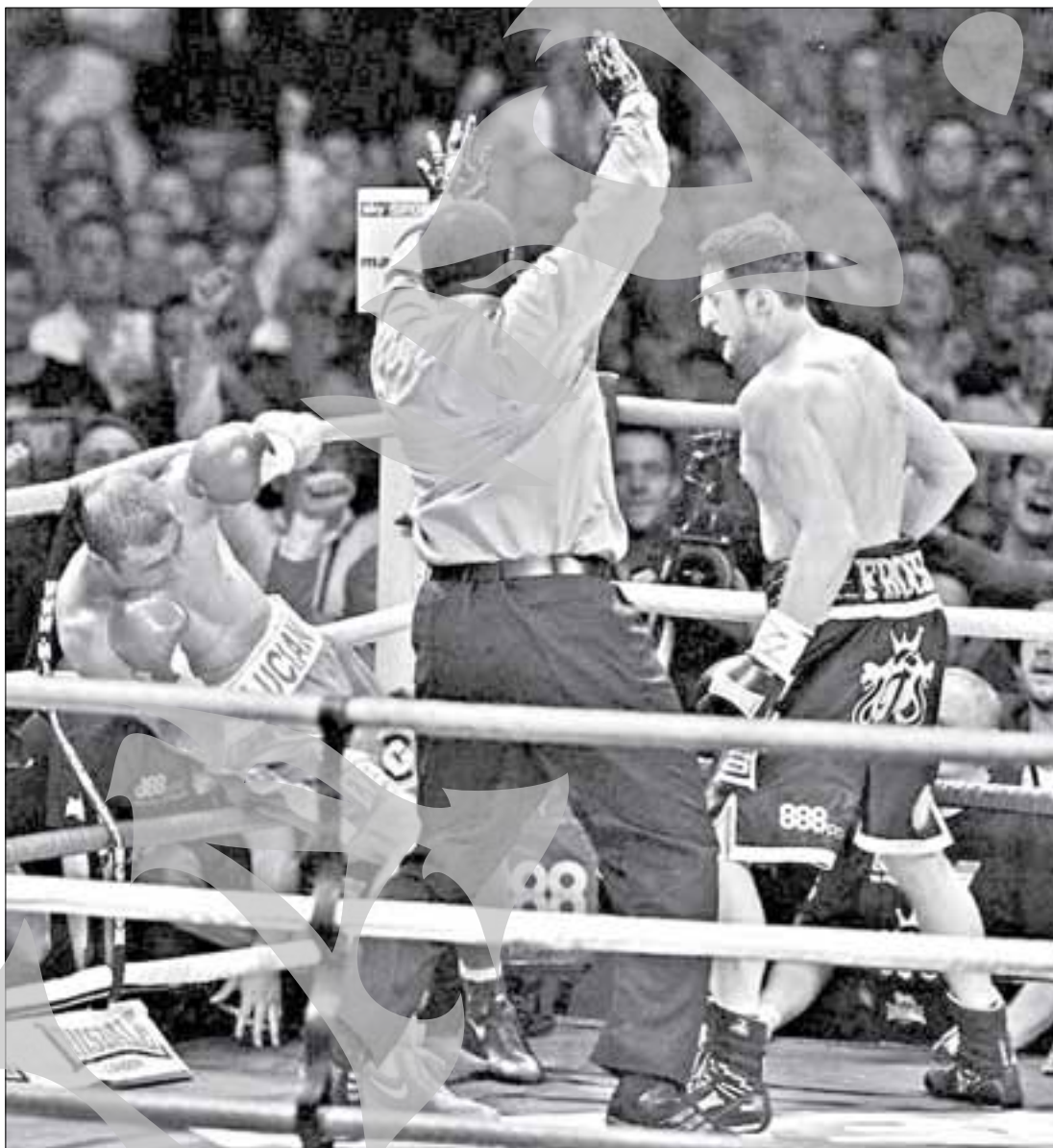
Momentul din repriza a cincea când Lucian Bute a fost făcut KO

Câteva sute de oameni au urmărit pe un ecran amplasat în centrul comunei Pechea meciul dintre Lucian Bute și Carl Froch, partidă în care Bute și-a pus în joc pentru a 10-a oară centura mondială la supermijlocie, în viziunea IBF. La finalul luptei pierdute de conșateanul idolilor, pechenii au plecat dezamăgiți spre case, spunând însă că