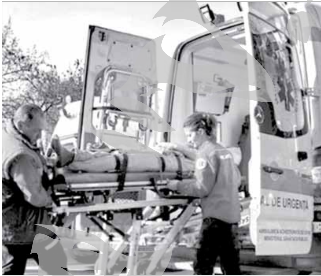
Un echipaj al ambulanței le-a transportat pe cele două victime la spital