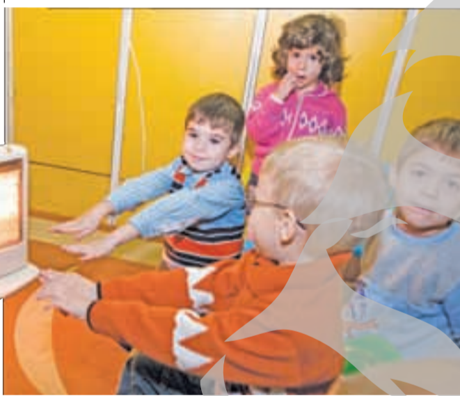
Căldura, una dintre problemele acute ale orașului

Campania „Vieții libere”: „Agenda publică a orașului”