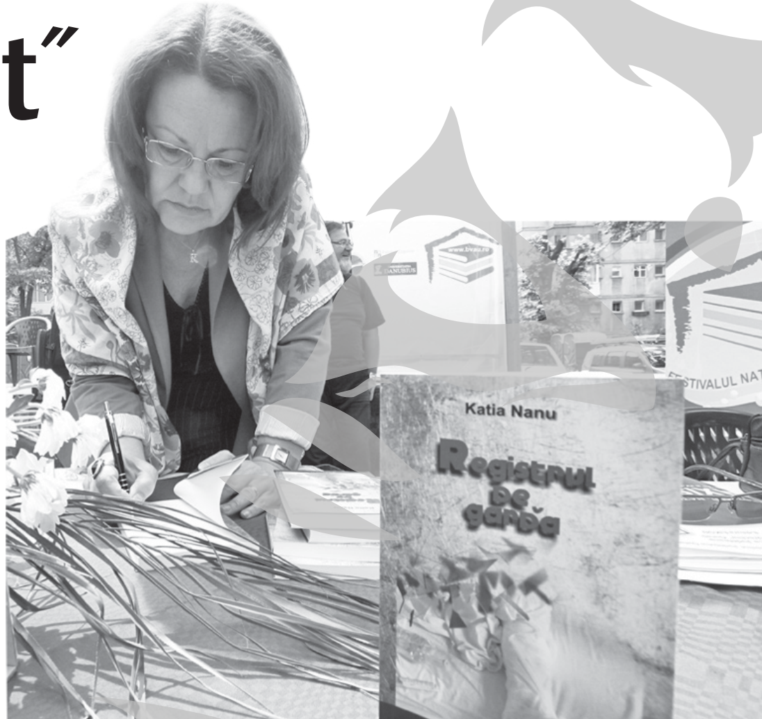
La finalul prezentării cărții, autoarea a oferit autografe

Prozatorul Theodor Parapiru, președintele Salonului lite- rar „Axis Libri”, remarca ieri că autoarea este „un nume bine constituit în jurnalistică și lite- ratură” (și am spune că se poate scrie oricând și invers...), care prinde lumea politicului și soci- alului reflectată în cea specială a spitalului. În final, cartea „oferă o rezolvare extraordinară” care face lectorul să dorească reluarea de