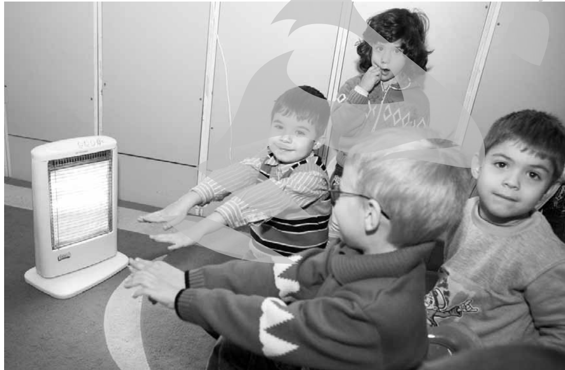
Căldura, una dintre problemele acute ale orașului

Pentru că gălățenii s-au săturat să le fie construite „din vorbe” poduri, drumuri expres, centuri ocolitoare și aeroport, am decis să lansăm „Agenda publică a orașului”. În cadrul acestei campanii, aspirații la fotoliul de primar au fost invitați să își spună soluțiile și proiectele cu privire la problemele acute ale Galațiului. Lunea trecută ați aflat ce planuri au candidații în privința garajelor. Astăzi vor răspunde unei noi provocări: cum văd viitorul societății Apaterm și cum va funcționa sistemul de termoficare din Galați? Din cei 12 candidați la Primăria Galați, șase