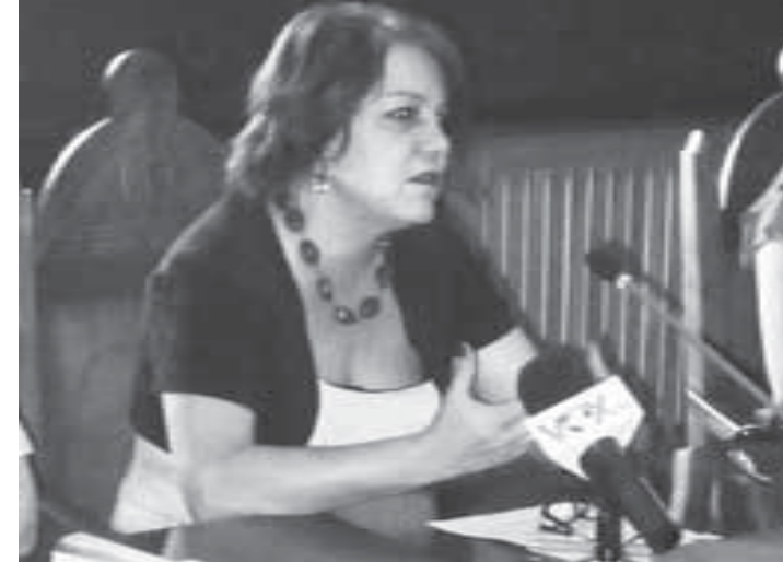
Directoarea APIA spune că avem mai mult de șase zone defavorizate

Conform datelor publice, în prezent, în județul Galați există doar șase localități declarate