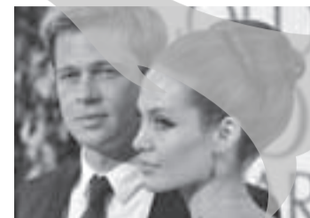
Brad Pitt, în vârstă de 48 de ani, și Angelina Jolie, în vârstă de 37 de ani, au o relație de aproximativ șapte ani, după ce s-au îndrăgostit pe platourile de filmare ale peliculei „Domnul și Doamna Smith”. Deocamdată, nu a fost anunțată data evenimentului mult așteptat.

Celebrii actori Angelina Jolie și Brad Pitt și-au exprimat dorința de a se căsători civil în Marea Britanie, în comitatul Windsor. Cele două staruri doresc ca nunta să aibă loc în cadrul unei ceremonii private, iar, ulterior, să plece în luna de miere în sudul Franței, la Chateau Miraval. „Tot timpul au visat la o ceremonie oficială care să aibă loc în secret, la care să participe numai copiii și familiile lor. Se gândesc să se căsătorească la oficiul stării civile din Windsor, acolo unde s-au căsătorit și Charles cu Camilla, dar și Elton John cu David Furnish”, a declarat un apropiat al cuplului, pentru presa internațională.