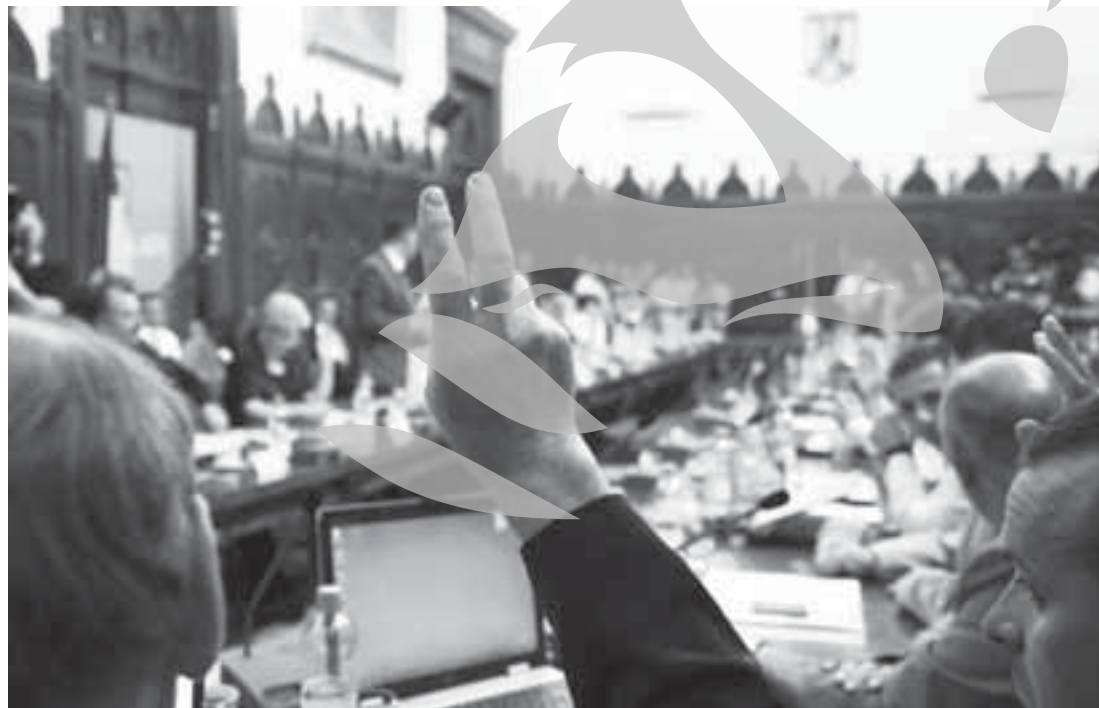
Majoritatea de 2/3 - mai mică cu doi consilieri!

Hotărârile care se iau cu majoritatea consilierilor în funcție sunt cele privind bugetul județului, contractarea de împrumuturi, precum și cele prin care se stabilesc impozite și taxe locale, participarea la programe de dezvoltare județeană, regională sau de cooperare transfrontalieră, organizarea și dezvoltarea urbanistică a localităților și amenajarea teritoriului, asocierea sau cooperarea cu alte autorități publice, cu persoane juridice române sau străine. Votul majorității este valabil și în cazul alegerii celor doi vicepreședinți și nu este exclus ca suspendarea celor doi consilieri ai APP să aibă legătură și cu acest lucru!