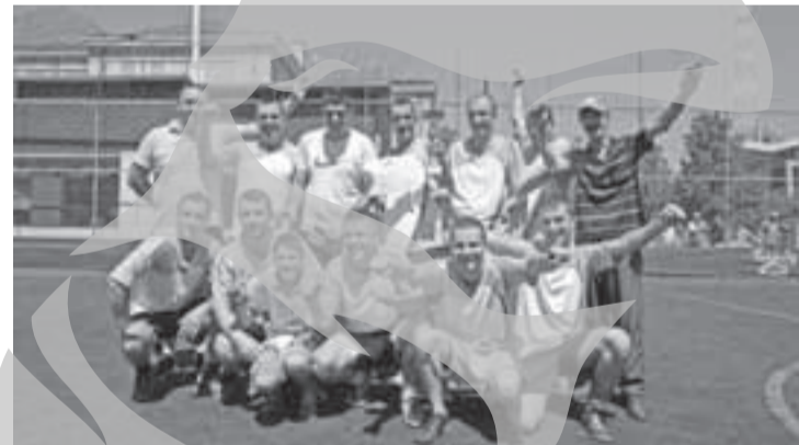
Ajax, după câștigarea Cupei „Viața liberă”

La întreceri vor lua parte 36 de echipe, repartizate în nouă grupe. Câștigătoarele acestor grupe