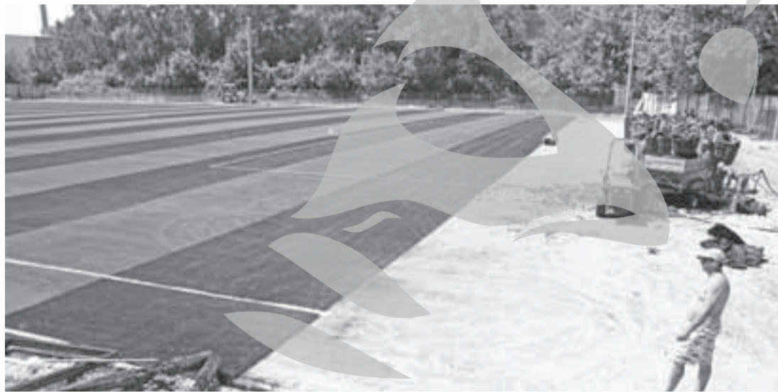
Acum se lucrează la montarea gazonului sintetic în jurul terenului de joc

La stadionul pe care urmează să se mute fotbalistii de la FCM Dunărea mai sunt de făcut doar vestiarele și tribuna Terenul, înconjurat de stâlpii de noaptea, a fost acoperit cu un gazon artificial de ultimă generație, iar în maxim zece zile se va putea juca pe el