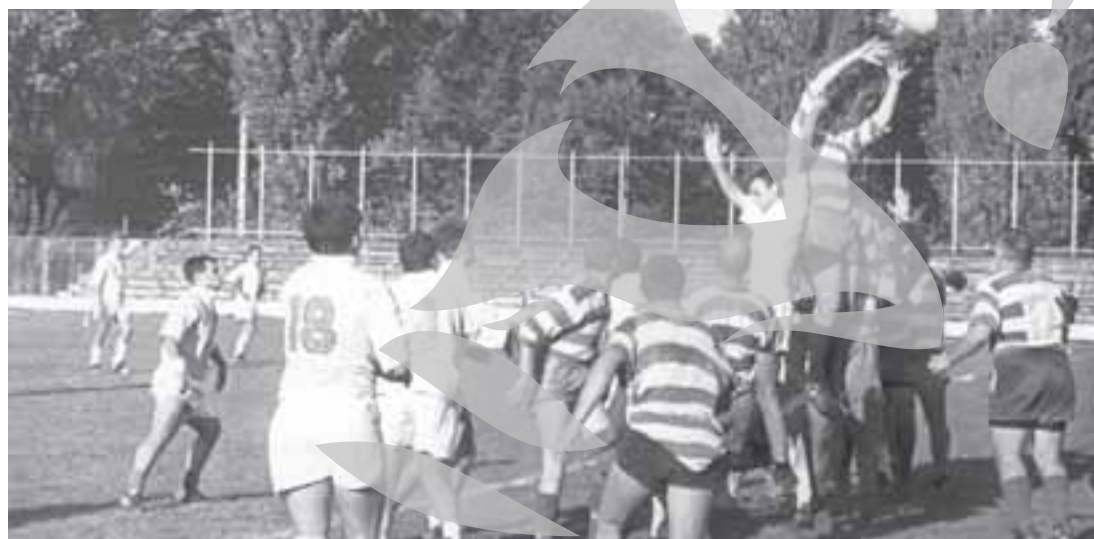
Imagine de la un meci din anii '70, când se juca pe stadionul Portu Roșu

Gheorghe Arsenie gheorghe@viata-libera.ro