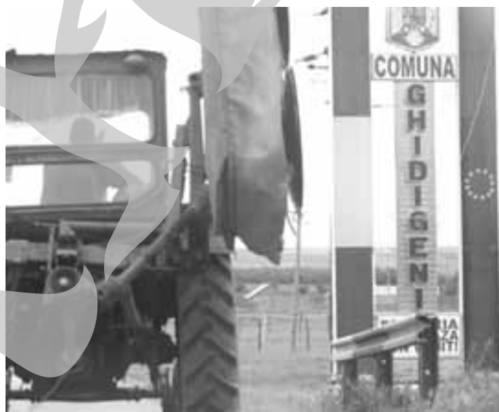
Ghidigeni, locul în care aleșii se contestă unii pe alții

„E drept, legea nu-i interzice să fie ales, dar cum să respecte cetățenii Legislativul comunei dacă din el fac parte oameni cu probleme de imagine?”, adaugă edilul. Poziția liberalilor s-a menținut și în a doua ședință de CL (pe 25 iunie, după cea din 22), iar la a treia ședință (pe 28 iunie), a ieșit prăpădit. „După ce l-am invalidat pe consilierul PSD, a venit rândul validării unui consilier liberal și cei din PSD nu l-au va-