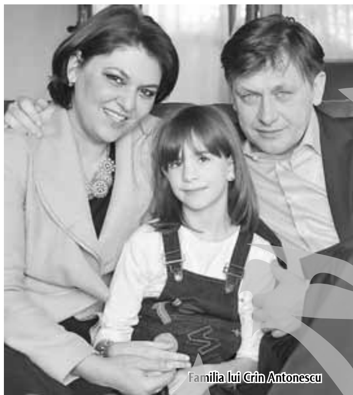
Familia lui Crin Antonescu