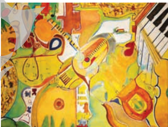
Doă dintre picturile Nastasiei Pirvu