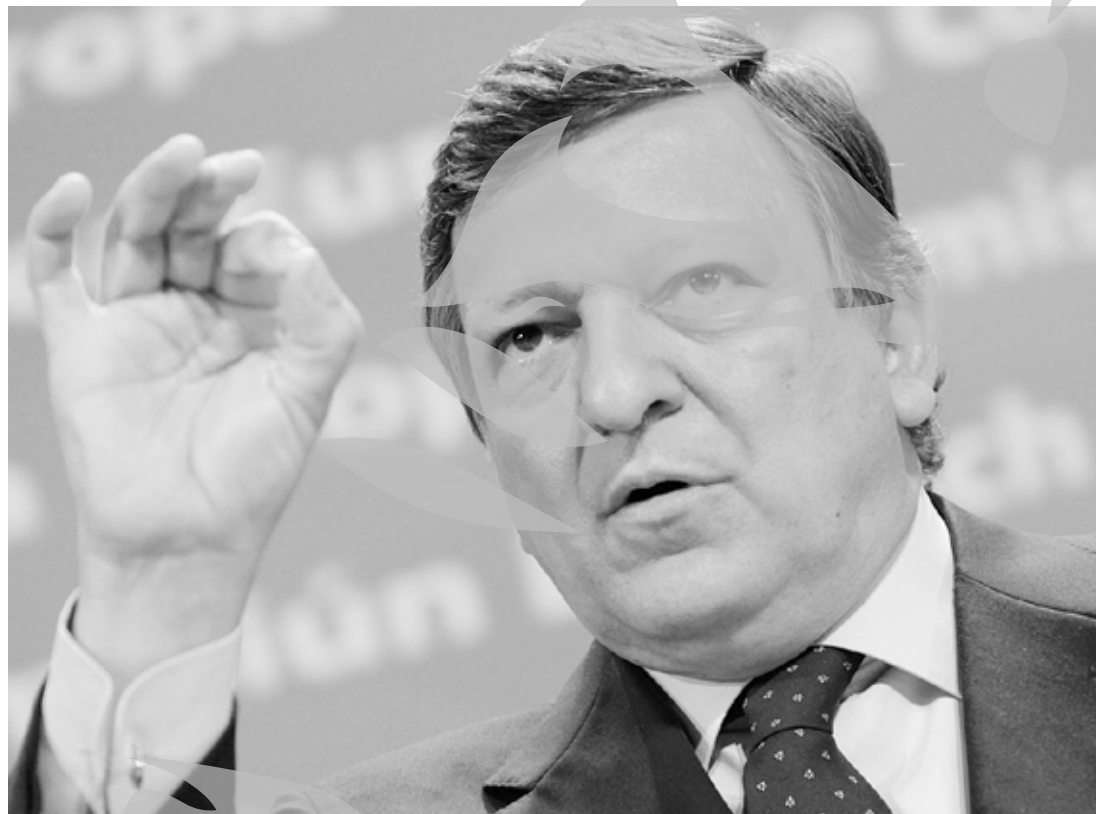
Jose Manuel Barroso, președintele Comisiei Europene

alegerea unui candidat cu o autoritate, o integritate și o independență de necontestat;