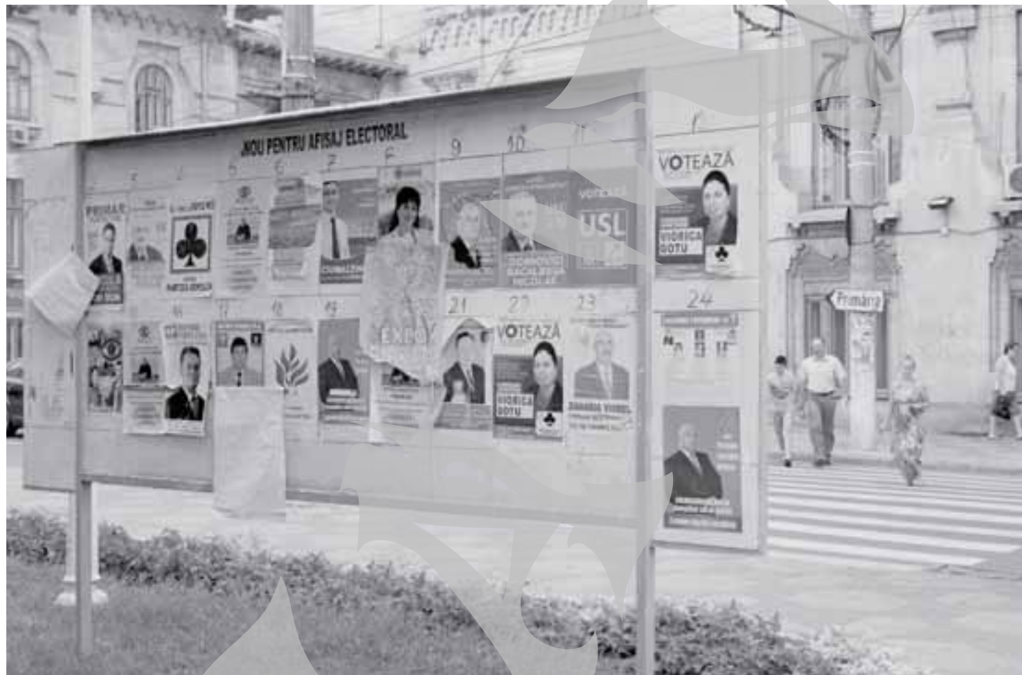
Unul dintre panouri este chiar în coasta Primăriei

De cealaltă parte, atât reprezentanții USL, cât și cei ai PDL spun că nu au primit încă niciun ordin de la „centru” pentru demararea campaniei electorale. Mai mult, se pare că niciun partid nu este interesat de aceste panouri și nu suferă foarte tare pentru că nu sunt amenajate. „Sunt șanse