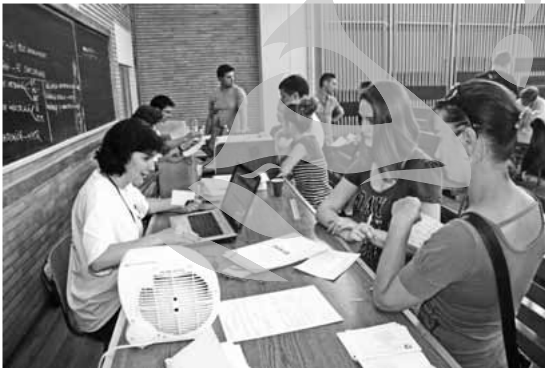
Facultățile tehnice, sub 1 pe loc

Într-un clasament neoficial al celor mai căutate facultăți mai intră, anul acesta, Științele Economice, Literele și Facultatea de Științe Juridice, Politice și Sociale. La specializarea Finanțe se adunaseră deja, până ieri, 59 de dosare pentru cele 21 de locuri fără taxă (2,81 pe loc), în timp ce la Contabilitate se inscrieseră 55 de candidați pe cele 21 de locuri (2,62 pe loc). La specializarea Drept din cadrul Facultății de Științe Juridice concurența era de 1,51 pe loc, iar la Științe Administrative concurența era de 1,19. La Facultatea de Litere, candidații cei mai mulți se înscrieseră la Științe Comunicării, unde concurența pe locurile fără taxă ajunsese deja la 1,7. Și la Facultatea de Educație Fizică și Sport concurența a ajuns la 1,63 pe un loc bugetat.