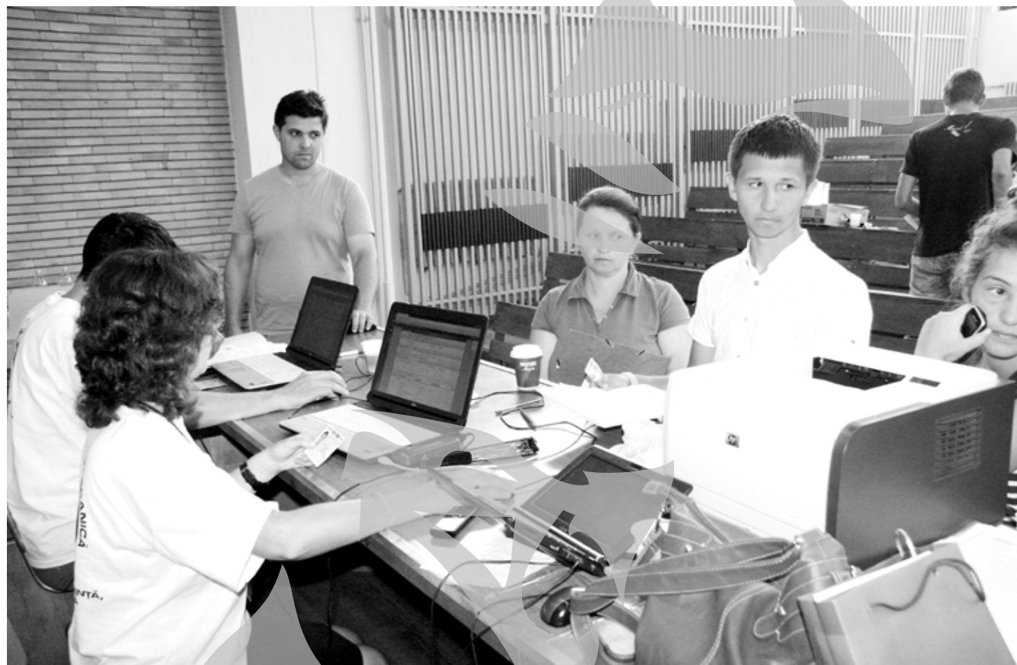
Anul acesta, nu a mai fost buluceala de anii trecuți de la înscrieri

De departe, cea mai mare surpriză de anul acesta este situația Facultății de Științe Economice, unde s-a înjumătățit numărul de candidați înscrși, după ce, în ultimii ani, instituția lua practic „crema” absolvenților de liceu. O situație poate chiar mai grea se mai întâlnește la Facultatea de Științe și Ingineria Alimentelor, care a ajuns la 130 de candidați pe 230 de locuri bugetate (concu- rență de 0,56 pe loc), în condițiile în care anul trecut avea 417 candidați înscrși (concu- rență de 1,9 pe loc). Și Facultatea de Istorie, Filosofie și Teologie a rămas cu aproape jumătate din numărul concurenților de anul trecut, 89 față de 166 (concu- rență de 0,81 față de 1,6 pe loc), însă cea mai