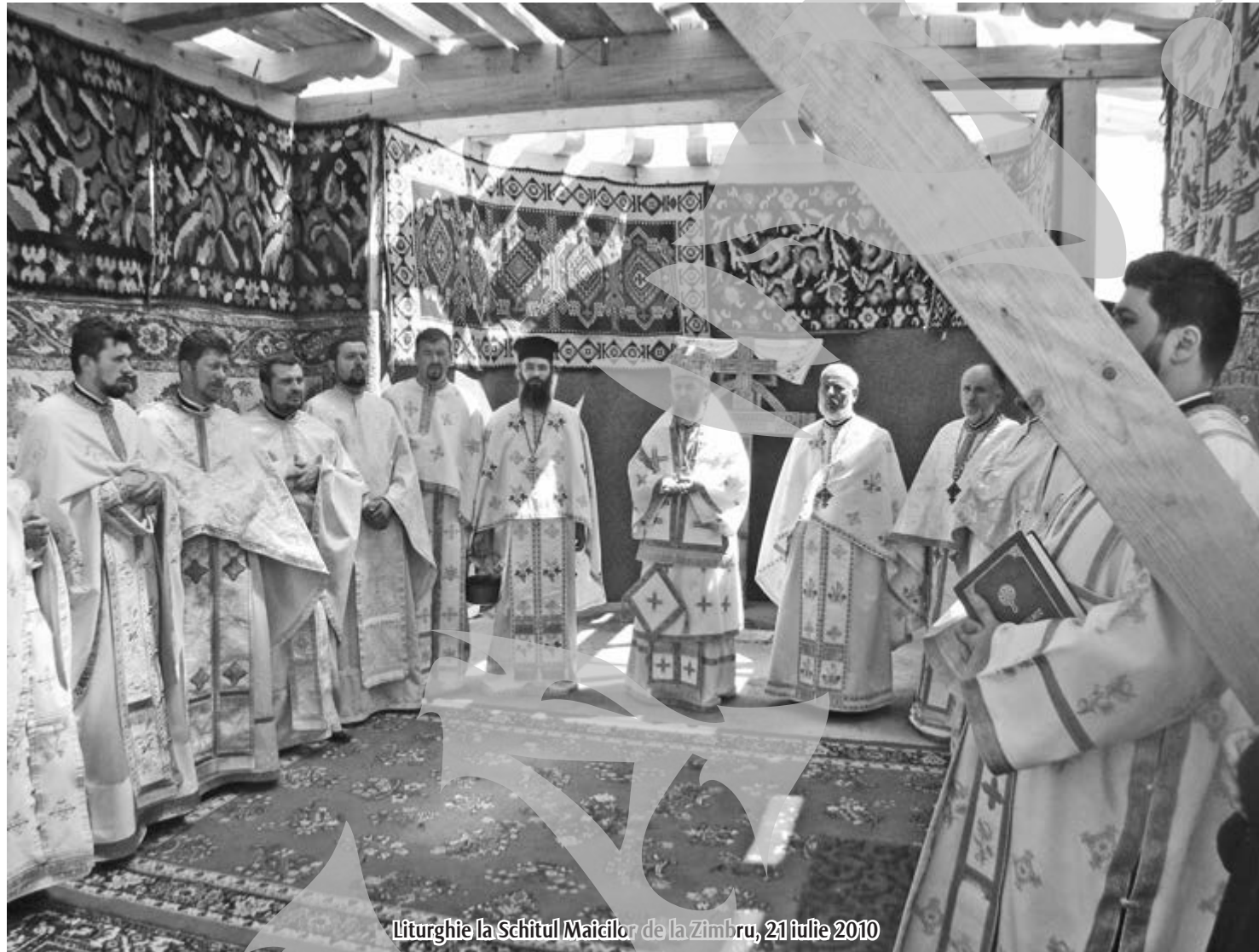
Liturgie la Schitul Maicilor de la Zimbru, 21 iulie 2010

În 1990, după ce libertatea de credință nu a mai fost un drept interzis, creștinii din Zimbru și Bursucani au început să scoată