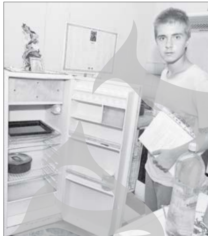
Unii locatari și-au golit deja frigiderule, pentru a nu li se strica mâncarea

„Pe luna mai, de exemplu, kilowatul la noi în cămin a fost facturat cu 0,61 lei, iar la alte cămine cu 0,58 lei. Pe fiecare apartament s-au facturat 200 kw! De unde atâta consum? Doar nu stăm toată ziua cu lumina aprinsă într-o singură cameră! Unde mai pui că, în contractele pe 2012, au vrut să treacă în contul liceului toate îmbunătățirile făcute pe banii noștri, pentru care avem rate la bănci! Vor să ia de la noi ca să acopere pierderile de la școală?”, ne-a spus indignat un alt locatar.