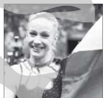
Sandra Izbașa, portdrapelul la ceremonia de închidere

Comitetul Olimpic și Sportiv Român (COSR) a decis ca gimnasta Sandra Izbașa, medaliată cu aur la sărituri la Londra, să poarte drapelul României la ceremonia de închidere a Jocurilor Olimpice care va avea loc duminică, de la ora 23.00. Luni, sportivii români medaliați la Jocurile Olimpice, conducerea COSR și componenții delegației României care au evoluat în ultimele zile la Olimpiadă vor reveni în țară, cu o cursă Tarom programată să aterizeze la ora 13.40, pe Aeroportul Henri Coandă. Olimpicii vor fi primiți la Salonul Prezidențial. România a obținut nouă