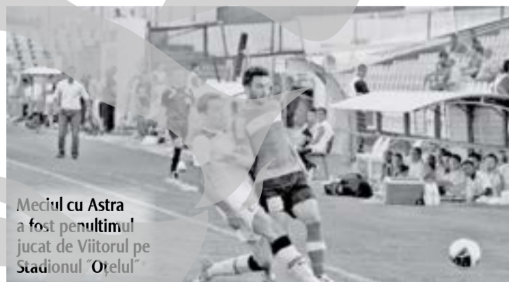
Meciul cu Astra a fost penultimul jucat de Viitorul pe Stadionul Oțelul

FC Viitorul va juca la Constanța partidele de pe teren propriu, începând cu meciul cu FC Vaslui din etapa a VII-a a Ligii I, programat la 1 septembrie, conducerea clubului patronat de Gheorghe Hagi și cea a FC Farul semnând, ieri, un contract de colaborare. „Este un contract avantajos pentru ambele grupări, care este valabil pentru acest sezon. Viitorul va avea drep-