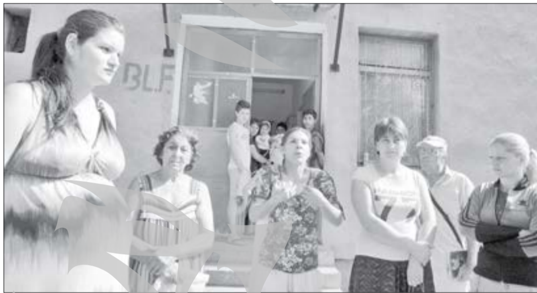
Chiriașii care își plătesc facturile sunt cei mai disperăți de situație