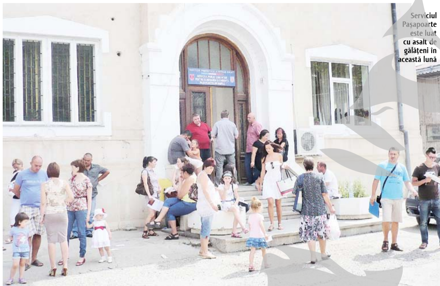
Serviciul Pașapoarte este luat cu asalt de gălățeni în această lună

Pașaportul temporar: mai ieftin, se eliberează imediat, dar faci trei drumuri și are valabilitate doar un an Pașaportul electronic: mai scump cu 60 de lei, dar faci un drum în minus și în următorii cinci ani n-ai treabă!