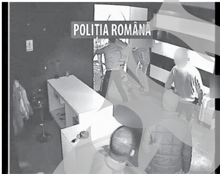
Imagine de la scandalul din ianuarie 2012